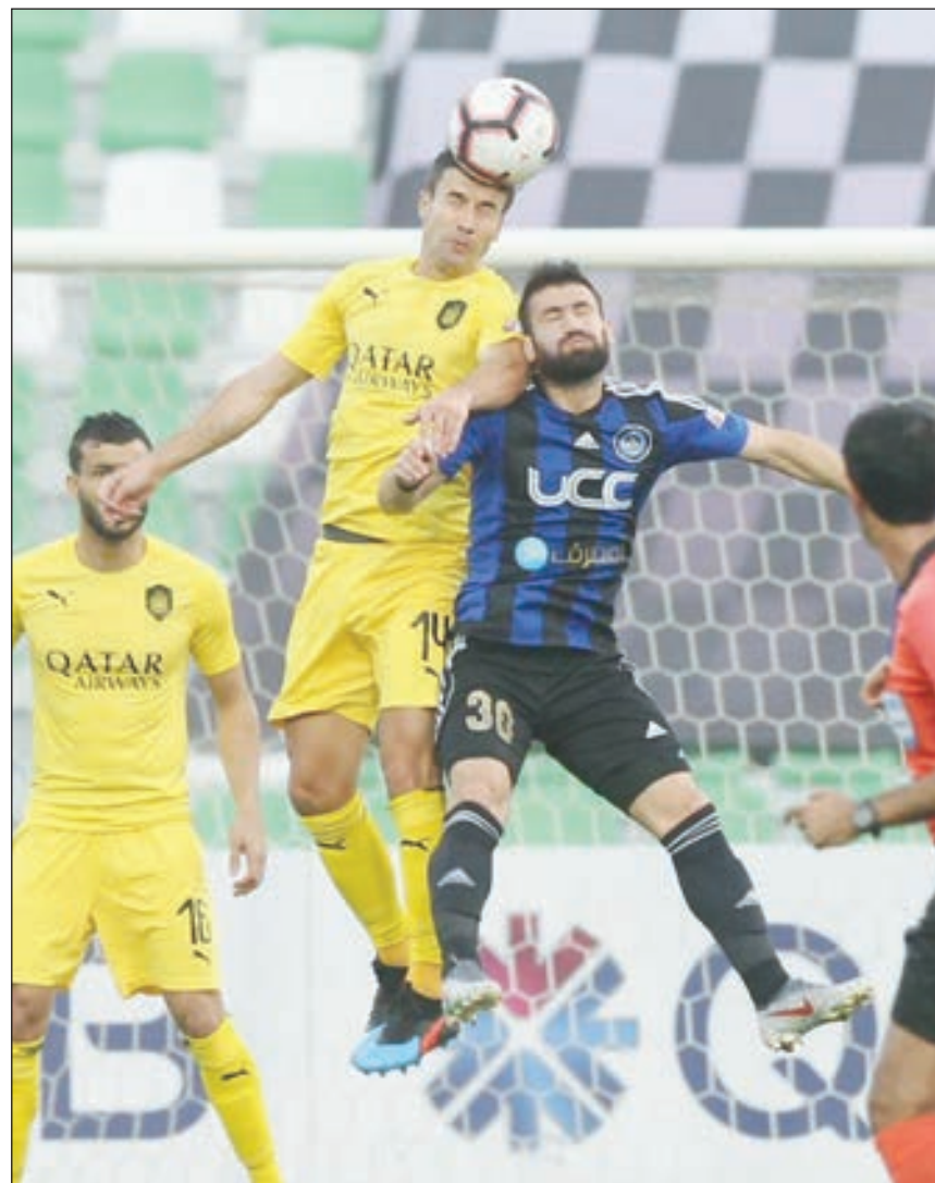
• صراع هوائي في مباراة السد والسيلية

أشاد جوزفالدو فيريرا، مدرب السد، بالانتصار الصعب الذي حققه فريقه على السيلية بنتيجة (2-1)، في الجولة 19 من دوري نجوم قطر. وقال فيريرا في المؤتمر الصحفي، عقب المباراة: «اعتبر مواجهة السيلية بمثابة إحدى أصعب المباريات هذا الموسم، وذلك بسبب الجهد البدني الكبير الذي بذله اللاعبون، وهذا الفوز يعطينا حافزاً كبيراً للمباريات المقبلة».