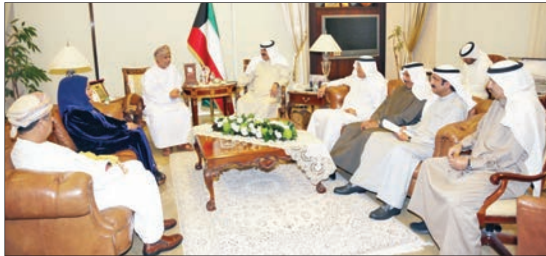
• خالد الجارالله لدى استقباله الوفد العماني

له دوام التوفيق وأن يكون عمله إضافة لتعزيز العلاقات بين البلدين. وأضافت ان اليحيا نقل تحيات نائب رئيس مجلس الوزراء وزير الخارجية الشيخ صباح الخالد، لوزير خارجية الباراغواي وتطلعه نحو توثيق وتعزيز العلاقات بين البلدين في كافة المجالات.