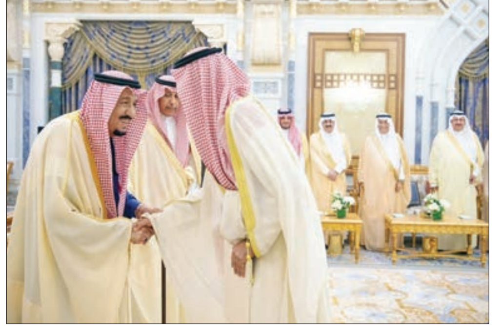
• الملك سلمان بن عبدالعزيز مستقبلاً الشيخ علي الخالد

واكد الخالد أن تكليفه سفيرا للكويت في المملكة تشريف كبير ويحمله مسؤولية كبيرة للعمل على استمرار وتنمية التعاون الثنائي بين البلدين في جميع المجالات السياسية والاقتصادية والثقافية والاجتماعية وغيرها. وأضاف ان العلاقة بين الكويت والسعودية لها خصوصيتها بما تمتلكه من عمق وجذور تاريخية وأواصر تربطها أخوة ونسب