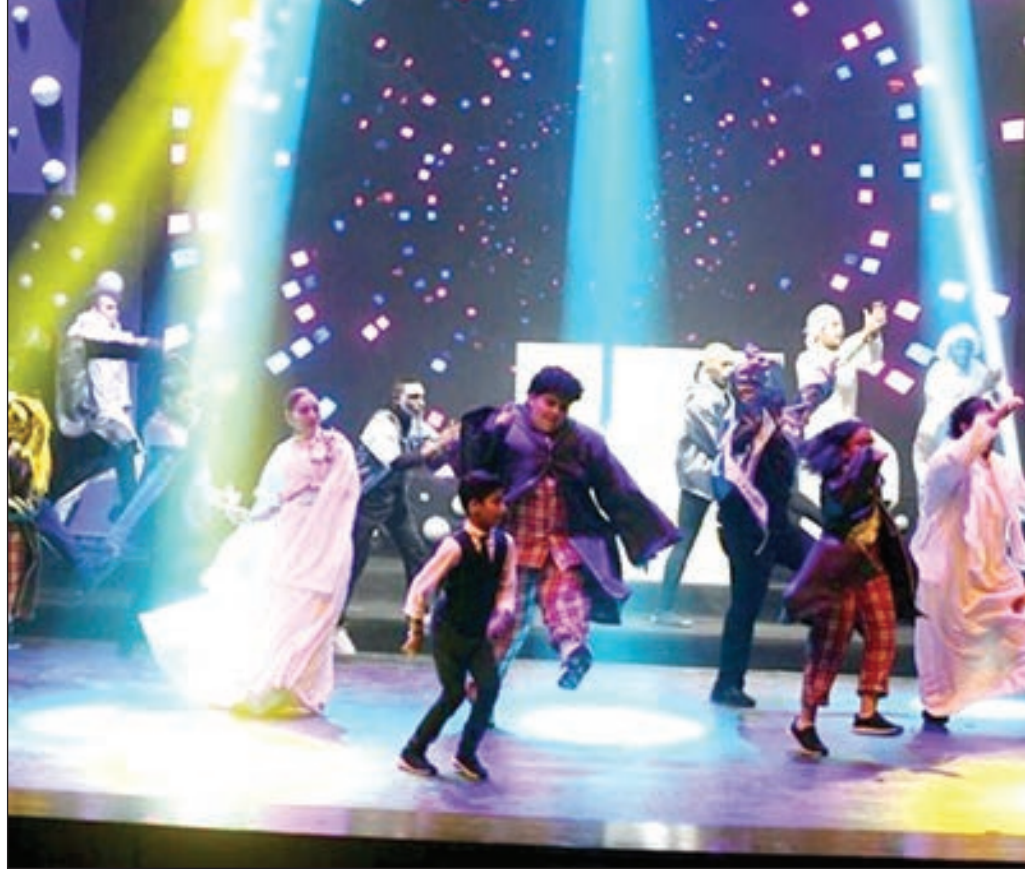
مشهد من الاستعراض

الحديث عن صقر الرشود حديث عن المسرح الكويتي في أوج نجاحه، العجيب في مسيرة هذا الفنان النادر أنه لم يقدم عملاً مسرحياً إلا وكان ناجحاً، علماً بأن أعماله المسرحية كان كثير منها باللغة العربية، والأعجب أن صقر الرشود سابق لعصره، وهذه حقيقة عرفناها بعد رحيله بسنتين طويلة، واليوم يقدم المعهد العالي للفنون المسرحية مسرحية تحدثت عن مسيرة هذا الفنان الكبير من تأليف علاء الجابر وإخراج د. حسن الحكم على خشبة مسرح حمد الراجبي بالسالمية، وهذهبادرة طيبة من إدارة المعهد تذكّر الأجيال الفنية الجديدة بفنان قدم أعمالاً مسرحية ستظل عالقة في ذاكرة المسرح الكويتي ومن حسن حظي أنني التقيت صقر الرشود في مسرح الخليج العربي بمقره السابق في القادسية، وحضرت تسجيل مسلسل قديم من بطولته اسمه «العنود» باستديو الماسية بالسالمية، حقيقة كنت في مطلع شبابي إلا أنني أدرك أنني أمام قامة فنية كبيرة، لقد سبق صقر الرشود من قبله وأتعب من جاء بعده، وجعل للمسرح الكويتي قيمة عالية، وقد جمع بين التأليف والتمثيل والإخراج إلا أنه أبداع كمخرج وإلى يومنا هذا لم يظهر مخرج مثله، ولو مد له في حياته لشاهدنا منه العجائب، إلا أنه لم يعيش سوى سبعة وثلاثين عاماً، ونحن هنا نتقدم للمعهد العالي للفنون المسرحية ممثلاً بعميده د.علي العنزي بوافر الشكر لأحيائهم الذكرى الأربعين لوفاة صقر الرشود صقر المسرح الكويتي وتذكر له: «بحمدون المحطة»، بخور أم جاسم، شياطين ليلة الجمعة، حفلة على الخازوق، علي جناح التبريزي، عريس بنت السلطان، وغير ذلك من الأعمال، وشكراً مرة ثانية للمعهد العالي للفنون المسرحية ورحم الله صقر الرشود ودمتم سالمين.