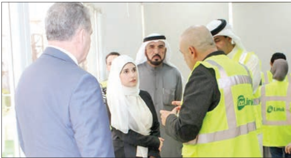
• جنان بوشهري خلال جولتها التقفدية

قامت وزيرة الأشغال العامة وزيرة الدولة لشؤون الإسكان د. جنان بوشهري بجولة تفقدية لمشروع إنشاء مبنى الركاب الجديد «T2» بمطار الكويت الدولي. وذكرت وزيرة الأشغال العامة ان الوزيرة حنت مقاول المشروع على سرعة إنجاز الأعمال بالجودة والكفاءة المطلوبة وفقا للمواصفات الفنية المعتمدة والالتزام بالبرنامج الزمني المتعهد به من قبل المقاول. يذكر أن مشروع مبنى الركاب الجديد «T2» أحد المشاريع الإنشائية المميزة في المنطقة ويحقق أحد الركائز السبع لرؤية «كويت جديدة 2035» المنبثقة من الرغبة السامية لجعل الكويت مركزا تجاريا وماليا اقليميا ودوليا.