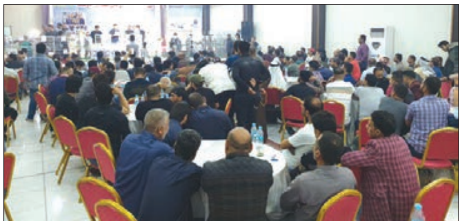
• جانب من المشاركين في المزاد

شهدت محافظة البصرة، أمس، إقامة مزاد للحمام الزاجل نظمه هيئة دولية مقرها في بلجيكا، وشارك فيه المئات من هواة تربية هذا النوع من الحمام من مختلف المحافظات العراقية. ولفت الشريف، إلى أن «المزاد تم خلاله بيع 60 طائراً جميعها مصفحة نولياً ومن سلالات أوروبية معروفة»، مضيفاً أن «أول طائر عرض في المزاد تم بيعه بمبلغ 11600 دولار، فيما تم بيع الطائر الثاني في المزاد بمبلغ 2500 دولار».