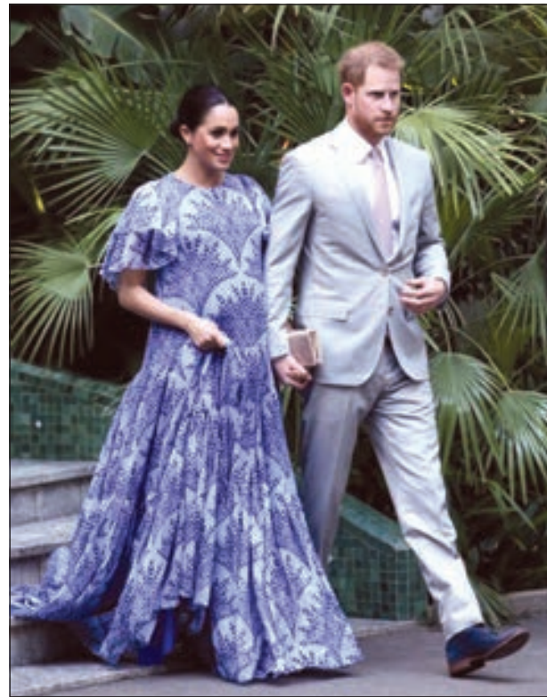
• الأمير هاري وزوجته ميغان دوق ودوقة ساسكس

وأضاف البيان «ستضمن هذه الخطوة التي يتم التخطيط لها منذ فترة طويلة وجود ترتيبات تقدم الدعم الدائم لعمل الدوق والدوقة مع بدئهما لحياتهما الأسرية وانتقالهما لمكان إقامتهما الرسمي في مقر فروجور الملكي».