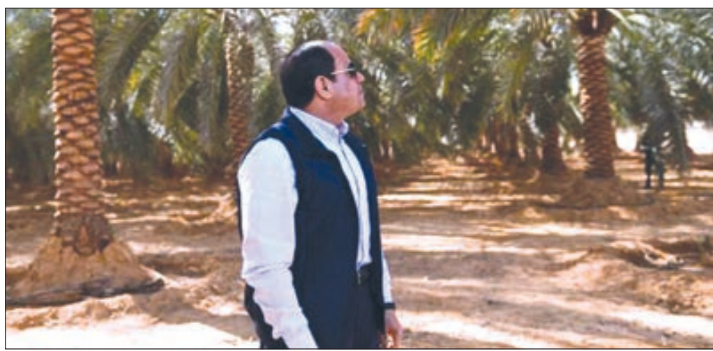
• الرئيس عبدالفتاح السيسي أثناء تفقده المزارع

تفقد الرئيس المصري عبد الفتاح السيسي فجر أمس عدداً من المشاريع التنموية في منطقة توشكي، وطاف في مزارع التمر والقمح والعنب.