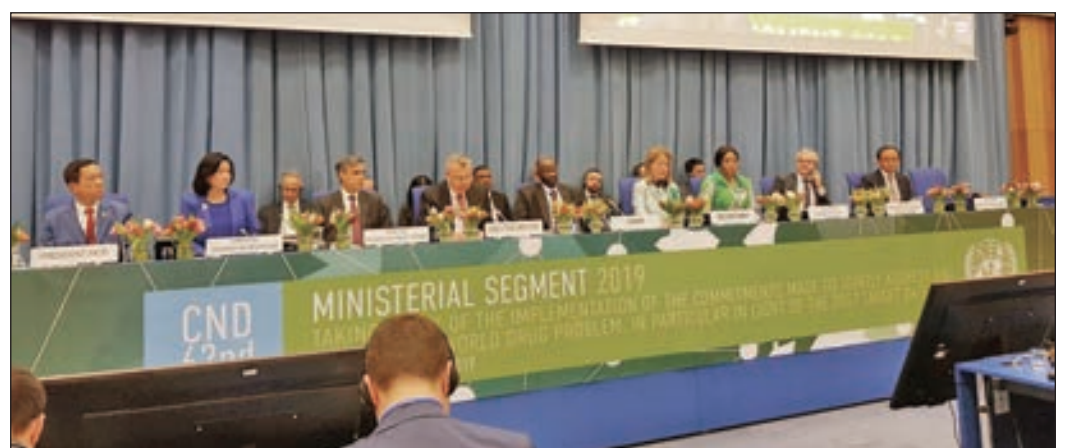
• جانب من أعمال الدورة

القطاعات المتخصصة في مكافحة المخدرات. وستتناول أعمال الدورة التي افتتحها المدير التنفيذي لمكتب الأمم المتحدة المعني بالمخدرات والجريمة يوري فيدوتوف تقييم تنفيذ الالتزامات المتعهد بها للتصدي لمشكلة المخدرات على المستوى الدولي ومدى التعاون بين الدول في هذا المجال. ومن أبرز الموضوعات المطروحة خلال الدورة تعزيز قدرة الكشف على العقاقير الاصطناعية ومراقبة المواد المستخدمة في الصنع غير المشروع