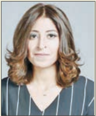
• شجون الهاجري

الى الفنانة الرائعة شجون الهاجري التي أصبحت اليوم نجمة بكل ما تحمله هذه الكلمة من معنى، كما انها اليوم القاسم المشترك لكثير من الاعمال الفنية، وقد قطعت شجون شوطا كبيرا من النجاح في فترة قصيرة، وهي اليوم في مقدمة ابناء جيلها في السينما والمسرح والتلفزيون، وكل عمل فني تكون شجون فيه يكون نصيبه النجاح فإلى الأمام.