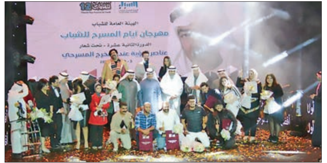
• الفائزون خلال الحفل