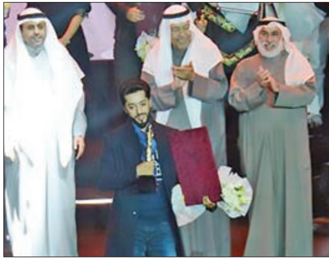
• فون يوسف البلغي كأفضل إخراج مسرحي