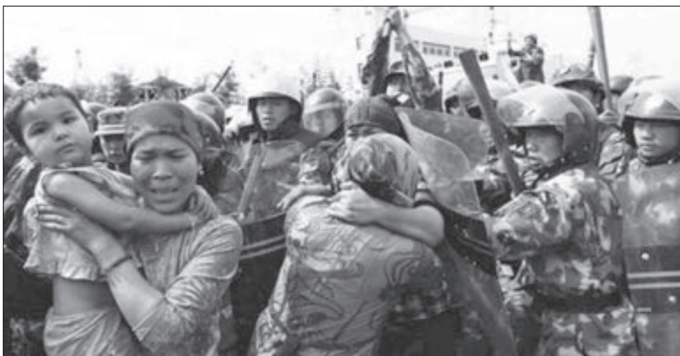
• انتهاك واضح للأقلية المسلمة

وقال إن الصين نفت في البداية وجود المعسكرات أصلا، مضيفا أن تفسيرها الآن بأنها تدريب عمالي طوعي «يتنافى مع الحقائق».