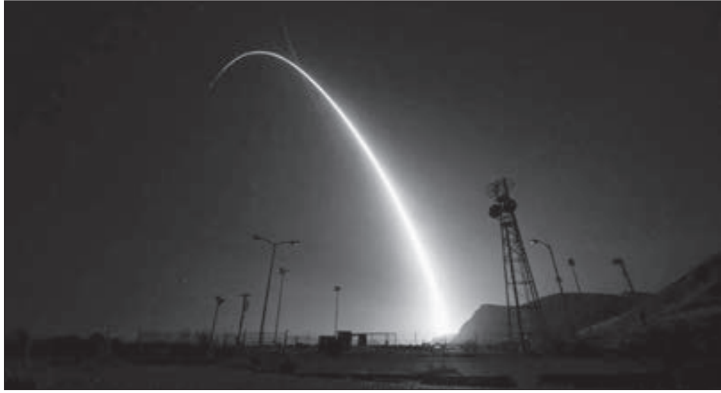
• اختبار صاروخي

الإتهامات الأميركية، مشيرة إلى أن واشنطن هي التي تخرق المعاهدة وتبحث عن نزاع بالمعاهدة لمدة ستة أشهر تمهيدا للانسحاب منها، وفي إجراء جوابي، أعلنت أيضا تعليق العمل بالمعاهدة، عملا بمرسوم أصدره الرئيس فلاديمير بوتين.