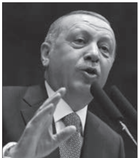
• رجب طيب أردوغان

يضع عشرات آلاف منافسيه السياسيين في السجن ويرتكب إبادة جماعية بحق الأكراد ويحتل قبرص الشمالية»، بعد أن اتهم الزعيم التركي رئيس الوزراء الإسرائيلي بأنه «الظالم الذي يقتل الأطفال الفلسطينيين وهم بعمر السبع سنوات»، داعيا إياه للعودة إلى رشده. من ناحية أخرى تستعد العاصمة التركية أنقرة، لتدشين مستشفى في «بيككتن» الذي يعد أكبر مستشفى في أوروبا والثالث عالميا من حيث الحجم والإمكانات.