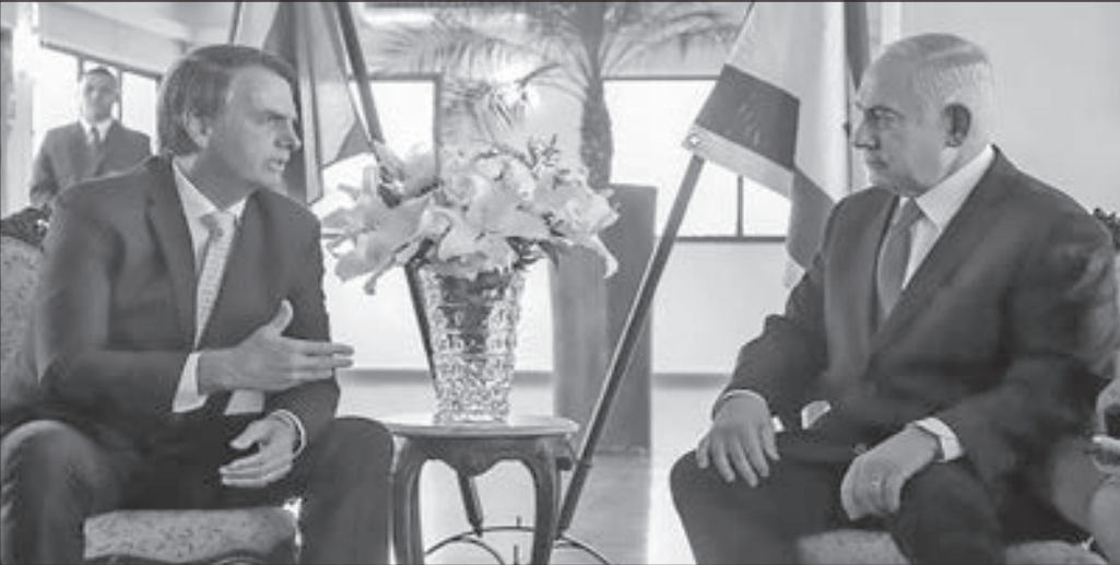
• بنيامين نتانياهو والزعيم البرازيلي

أكد مسؤول برازيلي أن قرار نقل سفارة بلاده من تل أبيب إلى القدس لم يتخذ بعد، ما يقلل من احتمال تنفيذ رئيس البرازيل جايير بولسونارو وعده بنقل السفارة خلال زيارته المرتقبة لإسرائيل.