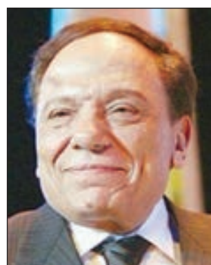
• عادل إمام

تستأنف الفنانة دلال عبدالعزيز مشاهدتها في مسلسل «فلانتينو»، للنجم الكبير عادل إمام، يوم السبت المقبل في ديكور منزلها، حيث تجسد دور زوجته خلال الأحداث. ويستمر التصوير لمدة يوم واحد وينتقل فريق العمل بعدها إلى ديكور آخر لاستكمال تصوير المشاهد الخارجية. مسلسل «فلانتينو» تأليف أيمن بهجت