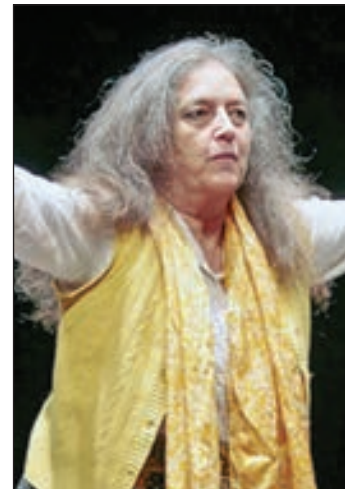
• جوليا فارلي

لكتابها «أحجار من الماء» في عام 2016 عن الهيئة العربية للمسرح، وهو العمل الذي يلخص سيرتها ومنظورها في المسرح. يعقب محاضرة جوليا فارلي التطبيقية توقيع للكتاب. مهرجان شرم الشيخ الدولي للمسرح الشبابي هو أول مهرجان تساهلي عالمي أو دولي يخصص بالشباب على أرض سيناء وتحديداً بشرم الشيخ مدينة السلام في احتفالية كرنفالية تتعش السوق السياحي والثقافي والفني لمحافظة جنوب سيناء من خلال استقطاب كل نجوم العالم ليحتموا على أرض مصرنا الحبيبة في تظاهرة ثقافية فنية وحضارية، تعكس مدى أهمية وقيمة الدور الذي تلعبه الثقافة والفن لفتح آفاق لسوق جديدة بمدينة شرم الشيخ.