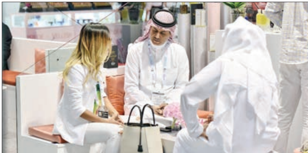
• دورات سابقة للمعرض

التجميل الملونة، وأدوات الزينة الرجالية» ستبلغ 34.9 مليار دولار في 2019 لتصل إلى 43.4 مليار دولار في 2022 بمعدل نمو سنوي مركب نسبتته 7.5%. وفي الإمارات، أنفق المستهلكون 2.1 مليار دولار في عام 2018 على سلع مثل العطور (610 ملايين دولار)، مستحضرات التجميل الملونة (297 مليون دولار)، منتجات العناية بالبشرة (306 ملايين دولار)، منتجات التزيين الرجالية (298 مليون دولار)، منتجات العناية بالشعر (323 مليون دولار)، ومنتجات الحمام والاستحمام (167 مليون دولار). ويتيح المعرض للعارضين الكثير من الفرص للظفر بشريحة من السوق عبر مساحته التي تبلغ 60 ألف متر مربع في مركز دبي، كما هو الحال منذ أكثر من عقدين في بيوتي ورلد الشرق الأوسط.