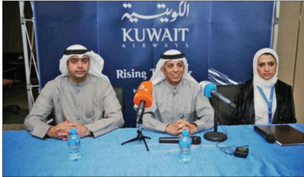
• جانب من حفل التكريم