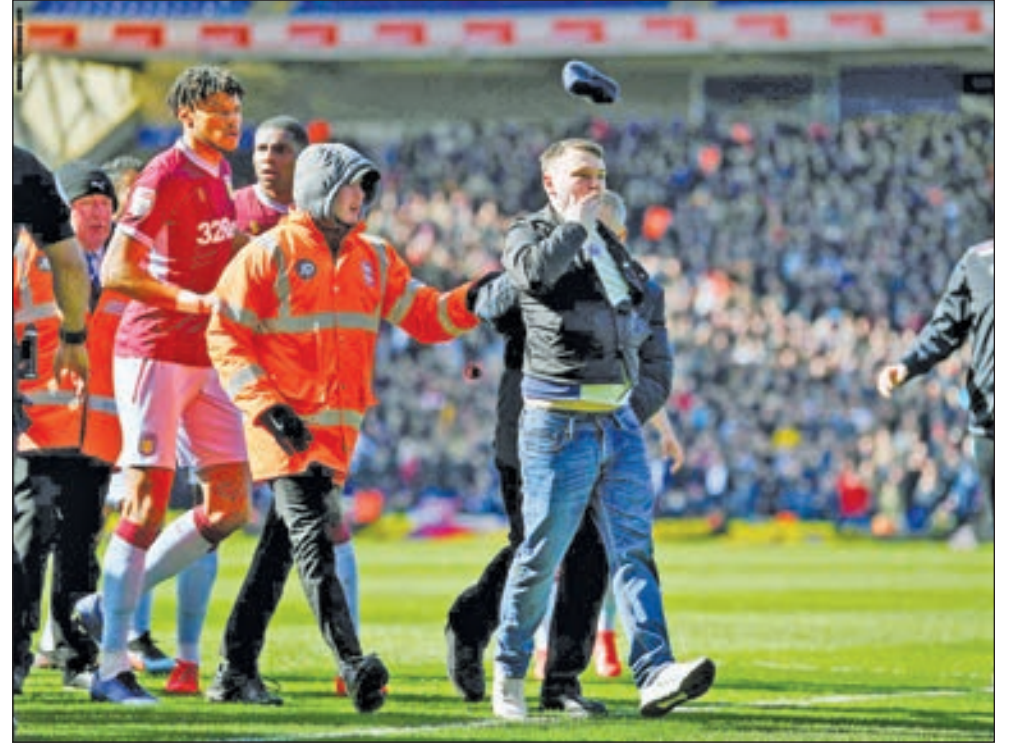
• لحظة إخراج المشجع بعد اعتدائه على اللاعب

انضم مانشستر سيتي الإنكليزي، إلى سباق جديد في سوق الانتقالات، يراحم خلاله بايرن ميونيخ الألماني لضم أحد نجوم الدوري الفرنسي. وبحسب ما ذكرته صحيفة «سبورت بيلد» الألمانية، فإن المان سيتي وضع عينه على نيكولاس بيبي، مهاجم ليل الفرنسي، لضمه خلال فترة الانتقالات الصيفية المقبلة. ودخل المان سيتي بذلك، سباقاً يجمع عمالقة أوروبا، يأتي على رأسهم البايرن وبرشلونة الإسباني وباريس سان جيرمان الفرنسي، للفوز بخدمات اللاعب. وجذب الدولي الإيفواري أنظار السيتي، بفضل تألقه مع ليل هذا الموسم، بتسجيل 17 هدفاً في الدوري الفرنسي، ليأتي ثانياً في قائمة الهدافين خلف كيليان مبابي، مهاجم باريس سان جيرمان. وكانت تقارير صحافية أفادت في وقت سابق باقتراب صاحب الـ23 عاماً من الانتقال إلى بايرن ميونيخ، عقب نهاية الموسم الحالي. وعلى جانب آخر يأمل بيبي غوارديولا، مدرب مانشستر سيتي الإنكليزي، في الإبقاء على لاعب وسط الفريق السماوي، لفترة أطول داخل ملعب الاتحاد. وتحصد المدرب الإسباني عن مستقبل لاعبه الألماني الكاكي غوندوغان، البالغ من العمر 28 عاماً، معرباً عن أمه في التجديد له. وخلال تصريحات أبرزتها شبكة