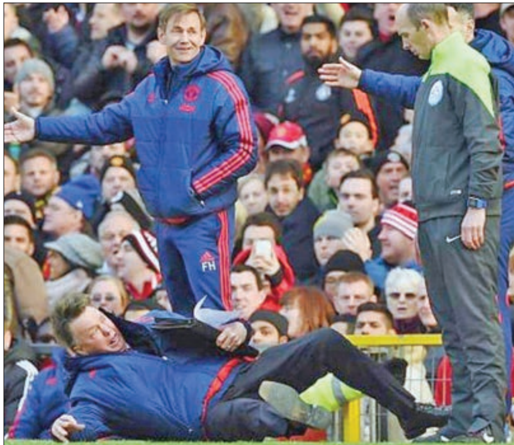
• فان غال ملقى على الأرض

أعلن الهولندي لويس فان غال، المدير الفني السابق لمانشستر يونايتد، تقاعده، مشيراً إلى أنه ليس لديه أي طموح مستقبلي في كرة القدم. وقال فان غال، خلال تصريحاته لقناة «VTBL» الهولندية: «أنا متقاعد الآن، وليس لدي أي طموح لكي أكون مديراً فنياً أو محلل تلفزيوني». وأضاف: «زوجتي تخلت عن وظيفتها منذ 22 عاماً، وكانت ترافقني في تجاربي الخارجية، وأخبرتني أنني سأعزّل كمدرب حين أصل لعامي الـ55». واستدرك: «لكنني استمرت حتى 65 عاماً، ويحق لها أن تعيش معي بعيداً عن كرة القدم، ويمكنني القول إنها سعيدة». واختتم: «أعتقد أنني كان بإمكانني العمل كمدير رياضي لكن في هذا المنصب لا يمكنني حضور الممران أو قول أي شيء خشية غضب المدرب أو الإدارة أو وسائل الإعلام، لذلك لا أعتقد أنني بحاجة إلى عمل من هذا القبيل». وتولى فان غال، القيادة الفنية لأندية أياكس وبرشلونة وبايرن ميونيخ ومنخب هولندا وإي زد ألكمار، وحصد مع البارشا لقب الليغا مرتين، ولقب الوندسليغا مع البايرن.