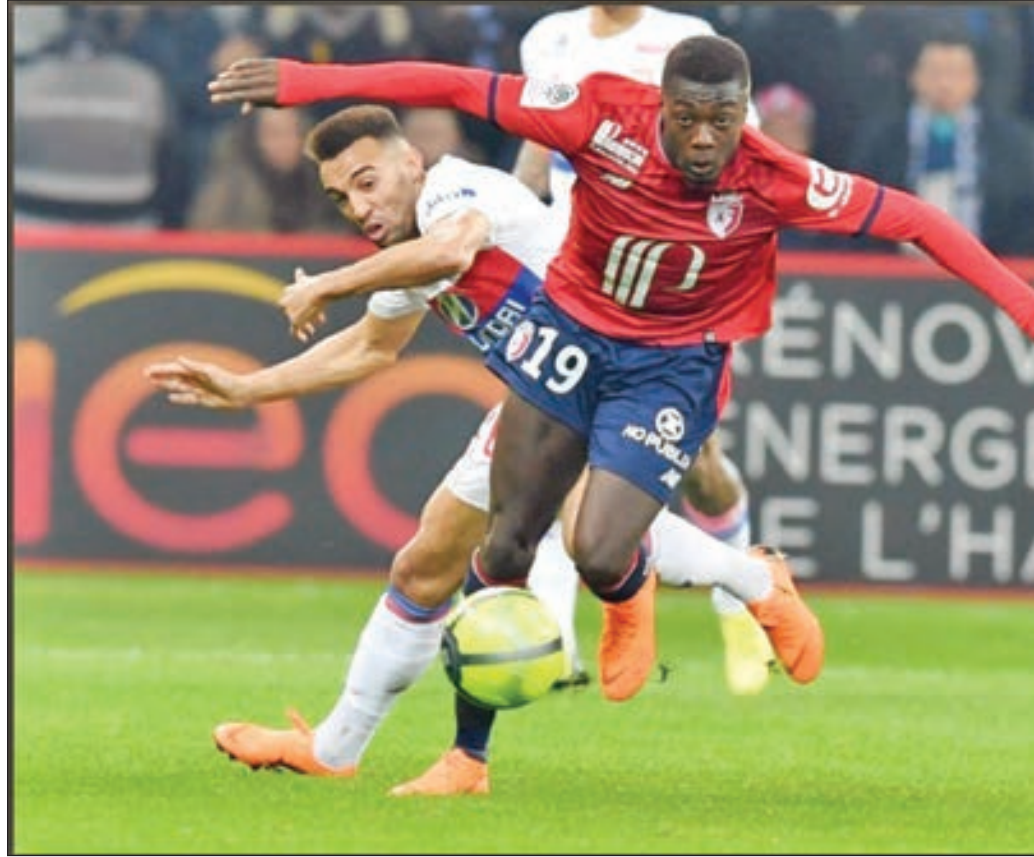
• نيكولاس بيبي يمر من الدفاع ببراعة

المقبل. وانضم الدولي الألماني لصفوف مانشستر سيتي في صيف 2016، قادماً من بوروسيا دورتموند مقابل 21 مليون جنيه إسترليني، موقعا على عقد يمتد حتى صيف 2020.