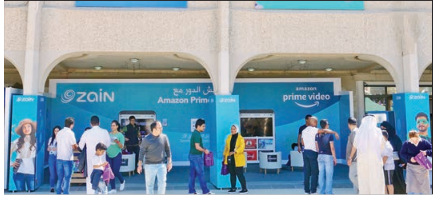
• من حفل الختام