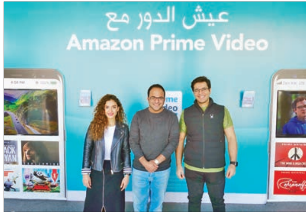
• مجموعة من المشاركين

والمسلسلات الحائزة على جوائز عالمية وإنتاجات Prime الأضلية على شبكاتها الأكثر تطوراً.