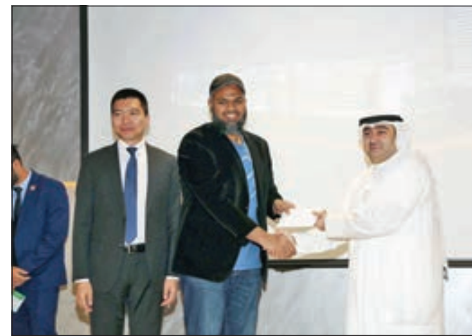
• أثناء حفل التكريم

تظمت شركة هواوي تكنولوجيز الكويت، الرائدة عالمياً في توفير حلول تقنية المعلومات والاتصالات، الحدث الأول من نوعه لتكريم المهندسين المتميزين الذين نالوا أعلى مستوى من الشهادات هواوي، وجمعت هذه الفعالية شخصيات بارزة من قطاع تكنولوجيا المعلومات والاتصالات من ضمنهم مسؤولين حكوميين وأكاديميين، ومعاهد التكنولوجيا، وشركاء الأعمال، وذلك للاحتفال بخريجي تكنولوجيا المعلومات والاتصالات المعتمدين من «هواوي» - HCIE لعام 2019.