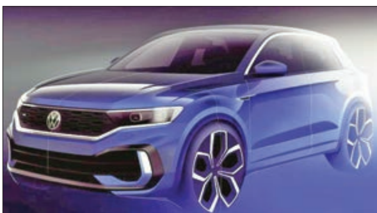
• فولكس فاجن

بدأت شركة فولكس فاجن الألمانية حملتها الترويجية لطرازها المرتقب T-Roc R المقرر طرحه للمرة الأولى أمام الجمهور ضمن فعاليات معرض جنيف الدولي للسيارات. ونشرت فولكس فاجن صورة تشويقية جديدة ظهر بها طراز T-Roc R مرسوماً كنوع من الاسكتش الخاص بتصميماته الأولية.