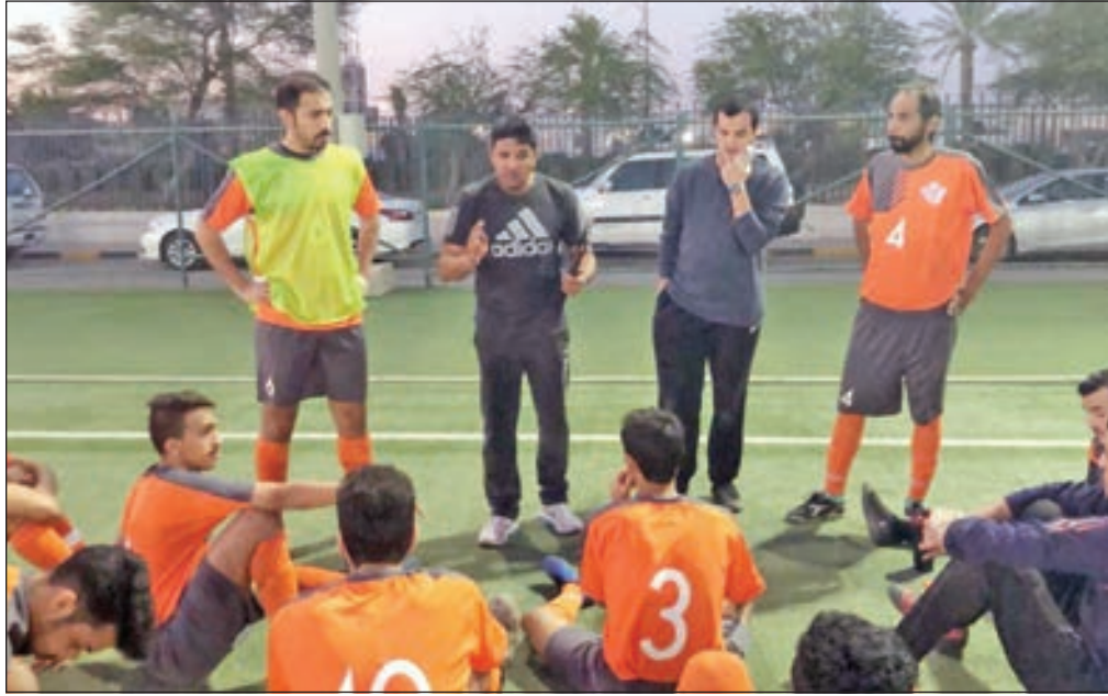
• فريق الإدارة العامة للجمارك