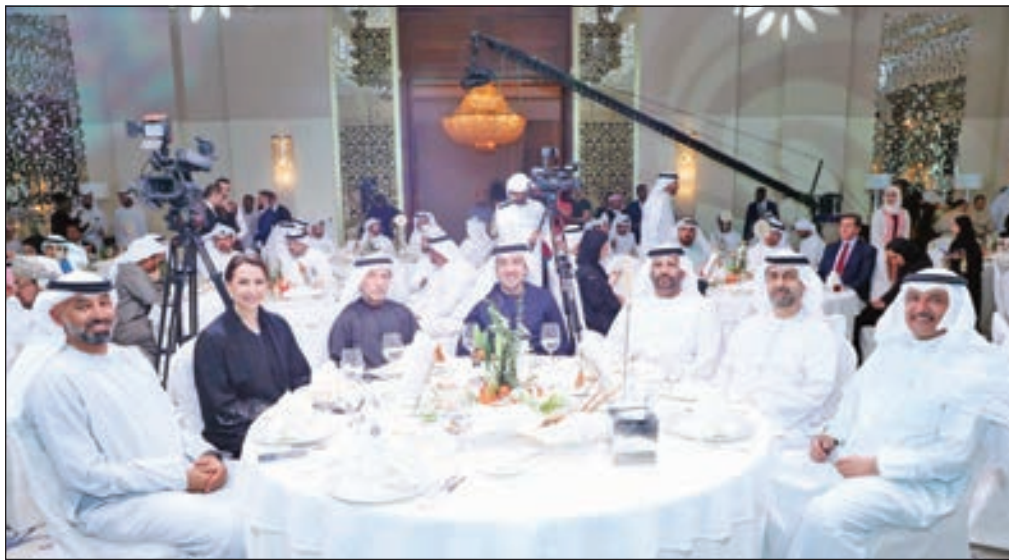
• عدد من الحضور

نحو 50 شركة في نهاية العام 2018، بإجمالي استثمارات بلغت نحو 631 مليون دولار، فيما بلغ عدد الفرص الاستثمارية التي قامت الهيئة بدراساتها نحو 115 فرصة، تمحورت بمجملها حول مشاريع الإنتاج النباتي والحيواني والتصنيع الغذائي والخدمات الزراعية، في الوقت الذي نفذت فيه نحو 69 برنامجاً تنموياً موجهاً لصغار المزارعين والمنتجين في الدول العربية، وبمساحات زراعية بلغت نحو 26 ألف فدان. كما خصصت الهيئة نحو 13 مليون دولار كخطوط تمويل لدعم صغار المزارعين والمنتجين ونحو 5 ملايين دولار لتفعيل نشاط الزراعات التعاقدية، في الوقت الذي بلغ فيه عدد المستفيدين من هذه البرامج نحو 93 ألف مزارع ومنتج. أما في مجال الأبحاث الزراعية وتوطين التقنيات الحديثة، فقد نفذت الهيئة نحو 95 تجربة بحثية تطبيقية في عدد من الدول العربية.