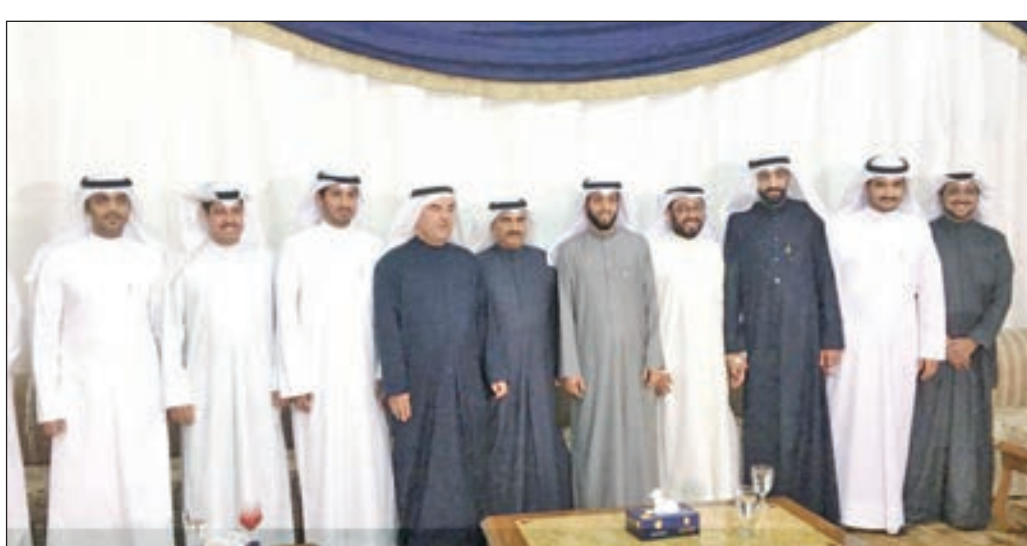
• عدد من الحضور في حفل جمعية المعلمين

وشدد العمي على حرصه على التواصل مع كافة الاطراف لخدمة العملية التعليمية والمعلمين والمعلمات منوها الى ان ابوابنا مفتوحة لتلقي كل الاقتراحات والانضمام لفرق العمل وخدمة اهل الميدان.