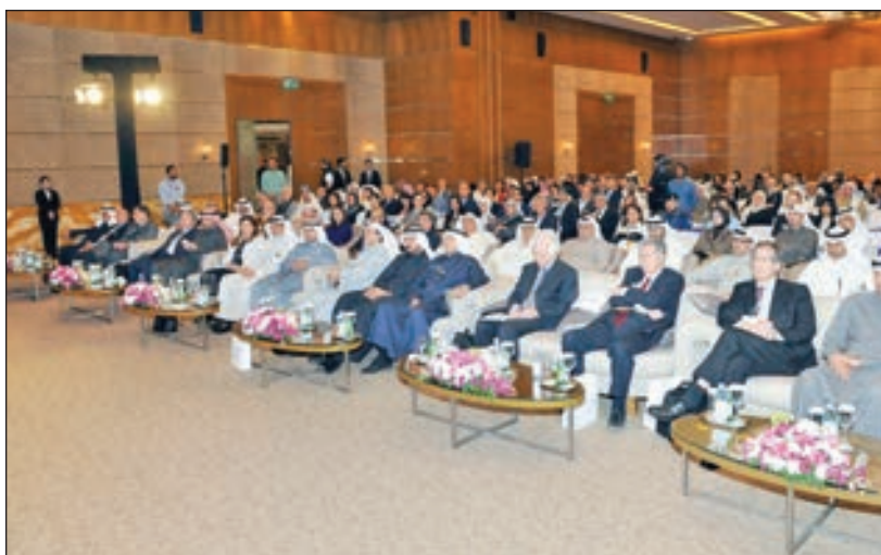
• خلال افتتاح المؤتمر