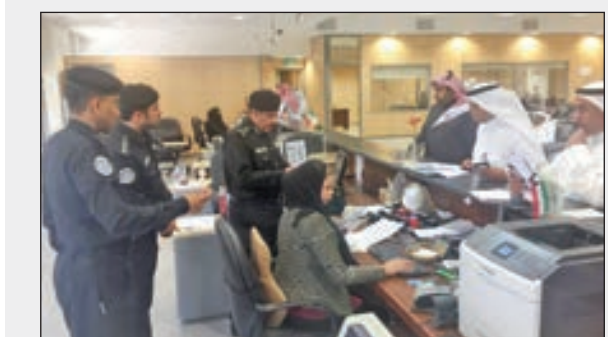
• أثناء الجولة التفقدية