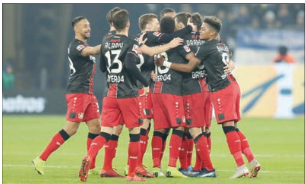
فرحة لاعبي ليفركوزن بالفوز

فاز باير ليفركوزن، على مضيفه هانوفر «3-2»، في المباراة التي جمعتهم في إطار الجولة الـ28 من الدوري الألماني. وعلى ملعب «أود أرينا»، تقدم الضيوف بهدفين مبكرين أحرزهما المهاجم كيفن فولاند في