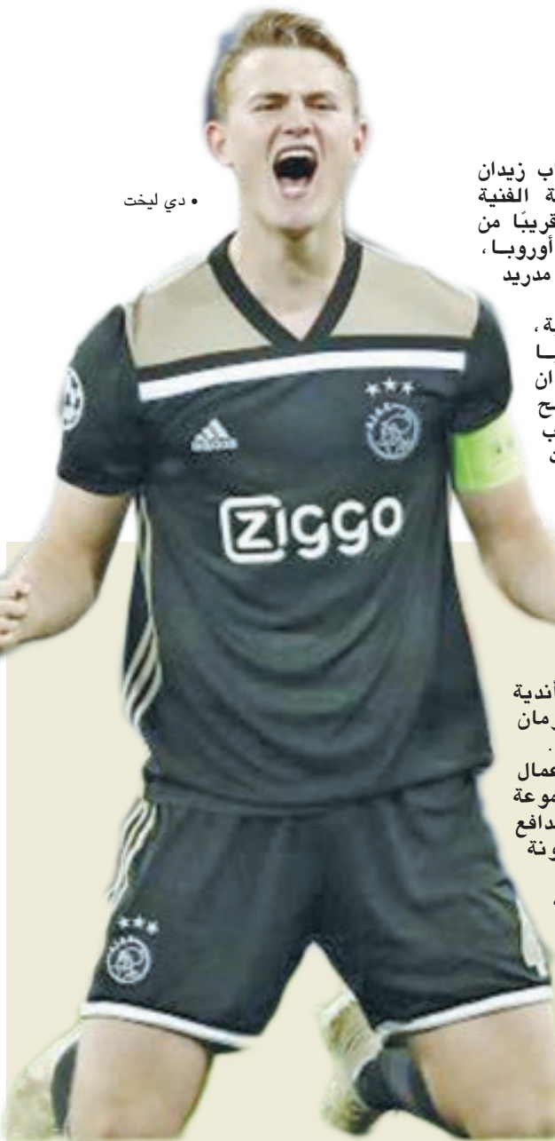
• دي ليخت

يرغب نادي برشلونة في تدعيم صفوفه بصفقة من نظيره سيلتا فيغو، خلال فترة الانتقالات الصيفي المقبلة. وذكرت صحيفة «سبورت»، أن برشلونة يتابع العديد من المهاجمين في الفترة الأخيرة، لتنشيط الخط الأمامي للبارسا في الميركاتو الصيفي المقبل. وأضافت الصحيفة أن الأوروغواياني ماكسي غوميز مهاجم سيلتا فيغو، يعد من أبرز المرشحين للعب بجوار مواطنه لويس سواريز في الموسم المقبل. ويحظى ماكسي غوميز بشعبية كبيرة داخل أروقة الإدارة الرياضية للنادي الكاتالوني، خاصة وأنه يمتلك لمحات مشابهة لسواريز. وتابعت الصحيفة أن ماكسي أصبح أكثر جاذبية لبرشلونة، حيث أن عقد اللاعب يحتوي على شرط جزائي بقيمة 50 مليون يورو، لكن فشل سيلتا فيغو في البقاء بالليغا سيخفض قيمة الشرط الجزائي إلى 25 مليون يورو. ونوهت إلى أن برشلونة سيحاول التحرك بسرعة من أجل التوصل لاتفاق مسبق مع اللاعب، خاصة وأنه من المتوقع أن يكون محل صراع شديد بين الأندية الأوروبية خلال الصيف المقبل. ويحتل سيلتا فيغو، المركز الـ18 بجدول ترتيب مسابقة الدوري الإسباني برصيد 25 نقطة بعد مرور 27 جولة.