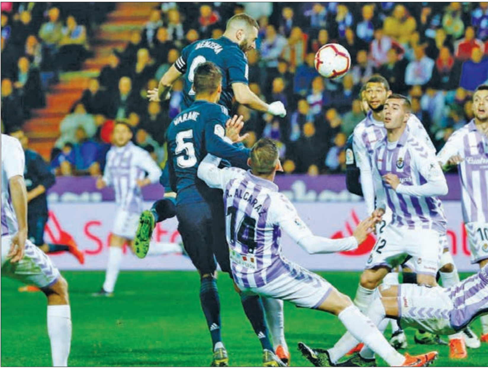
بنزيما يسدد على مرمى بلد الوليد

استعاد ريال مدريد نغمة الانتصارات مرة أخرى بالفوز على بلد الوليد بنتيجة «4-1» خلال مواجهة الفريقين، ضمن منافسات الجولة الـ27 من الليغا. تقدم أنور محمد بهدف رائع لبلد الوليد في الدقيقة «29»، بعد هدفين لمغنين بداعي التسلل وركلة جزاء ضائعة لصالح أصحاب الأرض. وانتفض الريال، ليسجل 4 أهداف ودفعة واحدة عن طريق فاران في الدقيقة «34»، وكريم بنزيما «هدفين» في الدقيقتين «51 و59»، ومودريتش في الدقيقة «85». أول تهديد في المباراة كان لأصحاب الأرض، حيث توغل بلانو في منطقة جزاء ريال مدريد في الدقيقة «11»، ليتدخل عليه بقوة أودريوزولا. واحتسب حكم المباراة ركلة جزاء لصالح بلد الوليد، نفذها اللاعب ألكاريز لكن تسديده علت مرمى الحارس كورتوا. وسجل غوارديولا هدفاً لصالح بلد الوليد في الدقيقة «13»، لكن لجأ الحكم إلى تقنية الفيديو لوجود شك في حالة تسلل، قبل أن يتخذ قراره النهائي بالإلغاء. وسجل غوارديولا هدفاً آخر من كرة رأسية في الدقيقة «18»، إلغاء الحكم المساعد بداعي التسلل، بعد اللجوء لتقنية الفيديو للمرة الثانية. واقترض بلد الوليد الهدف الأول في الدقيقة «29»، بأقدام أنور محمد بصناعة من سيرجي غوارديولا، الذي مرر له الكرة في منطقة الجزاء ليضعها بسهولة في الشباك. وعدل الفرنسي رافائيل فاران مدافع ريال مدريد، النتيجة للميرينغي في الدقيقة «34»، حيث استغل خطأ الحارس ماسيب في الخروج أثناء ركلة ركنية، وسدد الكرة في الشباك الخالية. وحاول كاسيميرو، أن يُضاعف