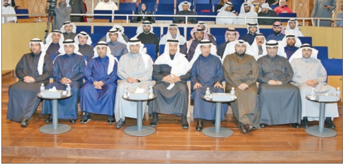
• سمو الشيخ جابر المبارك متوسطاً الحضور

باسل الصباح: اقتراح بتخصيص ساعة للرياضة بالمدارس للمساهمة في القضاء على المشاكل الصحية