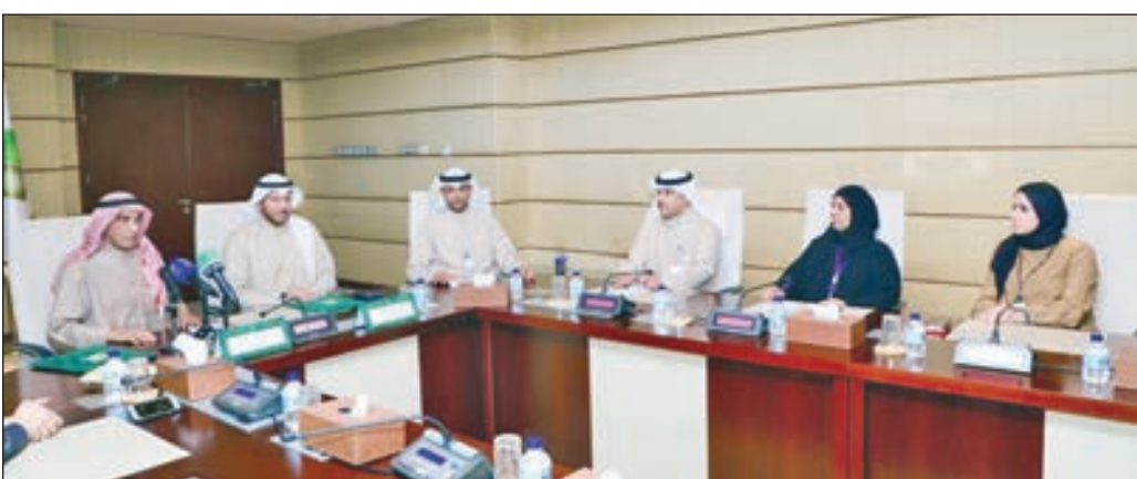
• الشيخ عبدالله الأحمد خلال توقيع المذكرة