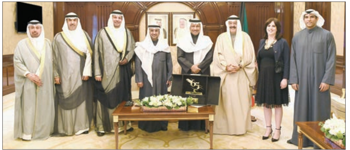
• سمو رئيس الوزراء متوسطاً مجلس إدارة الخطوط الكويتية

الحرس الوطني ومنظمة الناتو من خلال التدريب المشترك والزيارات المتبادلة والمشاركة في التمارين العسكرية لصفاء الخبرات والارتقاء بالأداء، وصولاً لتحقيق أهداف الوثيقة الاستراتيجية 2020 تحت شعار «الأمن أولاً»، التي تسعى