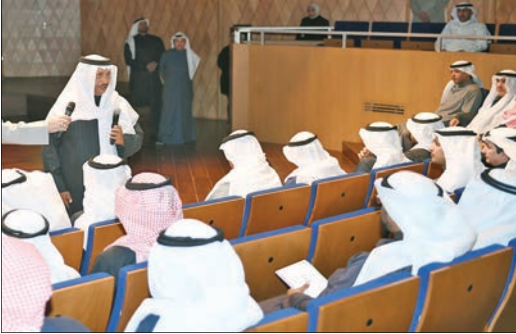
• سموه متحدثاً خلال اللقاء