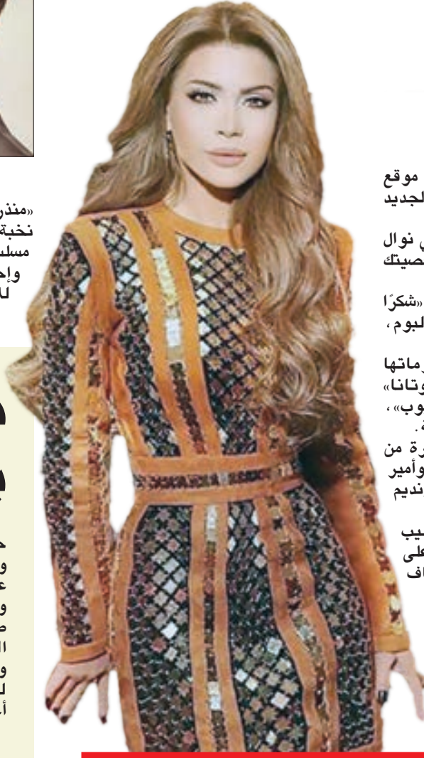
• نوال الزغبى

هنأت الفنانة كارول سماحة، عبر حسابها على موقع «تويتر»، الفنانة نوال الزغبى على ألبومها الجديد «كده باي» الذي طرحته خلال الأيام الماضية. وقالت «كارول» في تغريدتها: «مبروك يا عزيزتي نوال الزغبى ألبومك الجديد مليء بالطاقة مثل شخصيتك الحيوية».