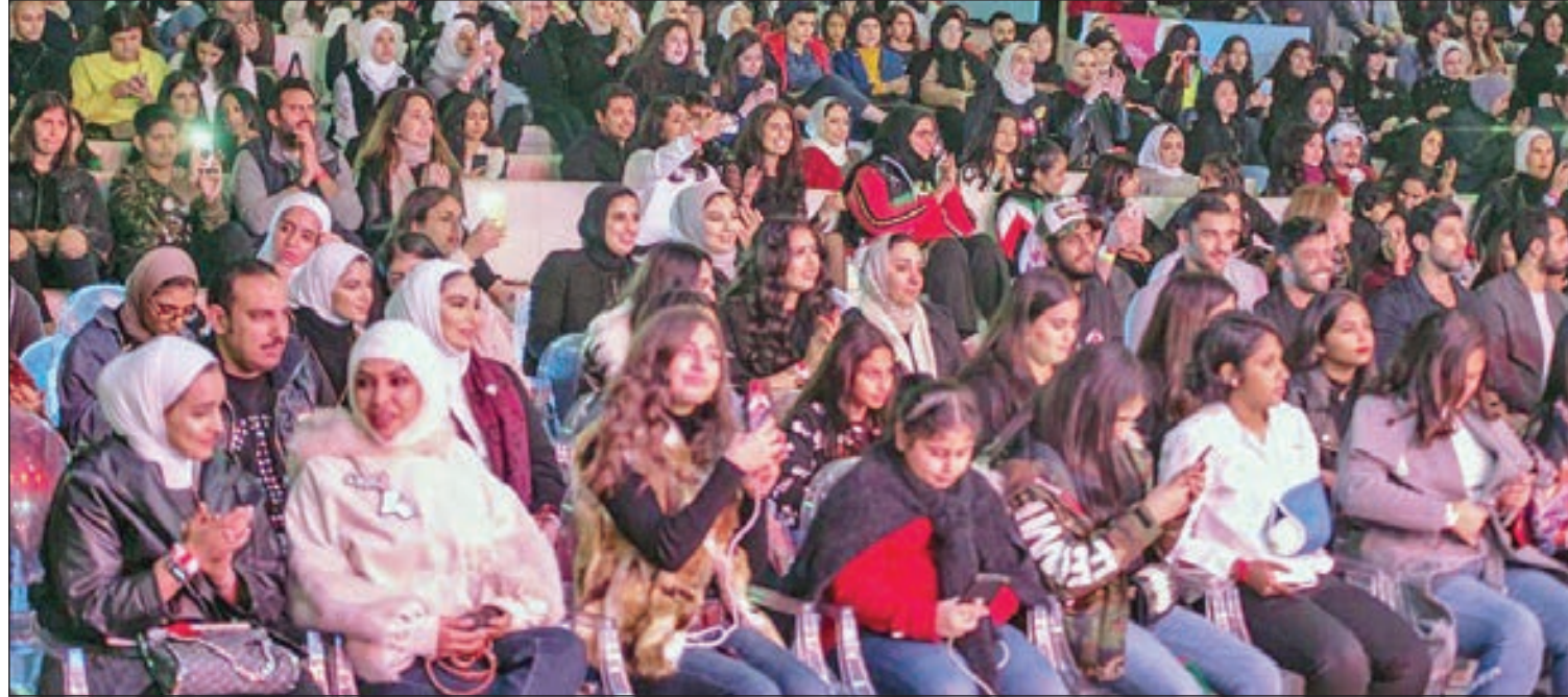
• جانب من الجمهور