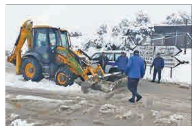
• الثلوج غطت الجزائر

تسببت كذلك في إغلاق 38 مدرسة، إضافة إلى انقطاع الكهرباء عن 50 منزلاً في ولاية سالزبورغ. أعلنت المديرية العامة للأمن الوطني الجزائري وفاة ثمانية أشخاص وإصابة 27 آخرين في حوادث مرورية مختلفة بسبب التقلبات الجوية التي تشهدها مناطق متفرقة من البلاد.