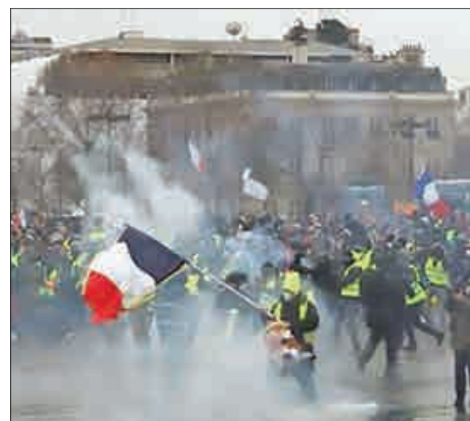
• احتجاجات «السترات الصفراء»

كشفت وزارة الداخلية الفرنسية أن نحو 84 ألف شخص تظاهروا بجميع أنحاء فرنسا وذلك في إطار احتجاجات «السترات الصفراء». على صعيد آخر خرج آلاف المحتجين إلى شوارع لندن، في أكبر مظاهرات للسترات الصفراء في بريطانيا حتى الآن ضمنًا لليمينيين واليساريين. وأفادت صحيفة «الإنديبندنت» البريطانية بأن المدينة شهدت في الواقع مظاهرات يسارية ويمينية باجندتين مختلفتين، لكن المشاركين في كليهما ارتدوا السترات الصفراء التي أصبحت رمزاً للغضب الشعبي على خلفية موجة الاحتجاجات التي اجتاحت فرنسا خلال الأشهر القليلة الماضية. وأوضحت الصحيفة أن مئات المتظاهرين اليمينيين المؤيدين لخروج بلادهم من الاتحاد الأوروبي احتشدوا أمام محطة مترو سانت جيمس بارك، فيما توجه آلاف آخرون يساريين بمسيرة من شارع أكسفورد ستريت إلى ساحة الطرف الأغر، احتجاجاً على برنامج التقشف الحكومي.