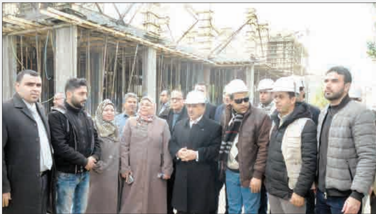
• وزير الأشغال والإسكان الفلسطيني أثناء تفقده المشروع الذي نفذته الكويت