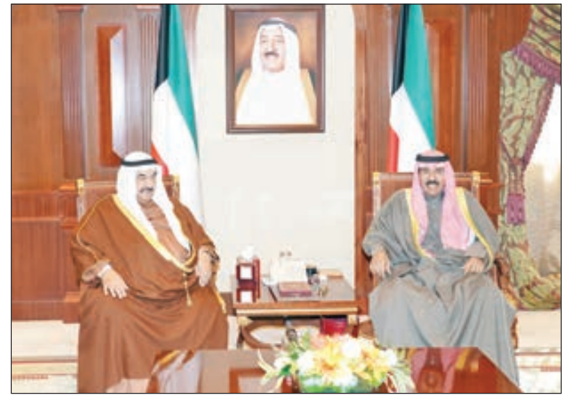
• سمو ولي العهد مستقبلاً سمو الشيخ ناصر المحمد

استقبل سمو ولي العهد الشيخ نواف الأحمد، بقصر بيان أمس، سمو الشيخ ناصر المحمد.