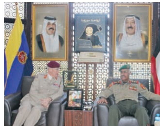
• محمد الخضر خلال استقباله الفريق لوريمير

استقبل رئيس الأركان العامة للجيش الفريق الركن محمد الخضر بمكتبه أمس، مستشار الدفاع الأول البريطاني لشؤون الشرق الأوسط الفريق السير جون لوريمير، والوفد المرافق له، وذلك بمناسبة زيارته للبلاد. حيث تم خلال اللقاء تبادل الأحاديث الودية، ومناقشة أهم الأمور والمواضيع ذات الاهتمام المشترك، لاسيما المتعلقة بالجوانب العسكرية. حضر اللقاء أمر القوة الجوية اللواء الركن طيار عدنان الفضلي ومعاون رئيس الأركان العامة لهيئة العمليات والخطط اللواء الركن محمد الكندري والملحق العسكري البريطاني لدى البلاد العقيد طيار فينلي ماكين.