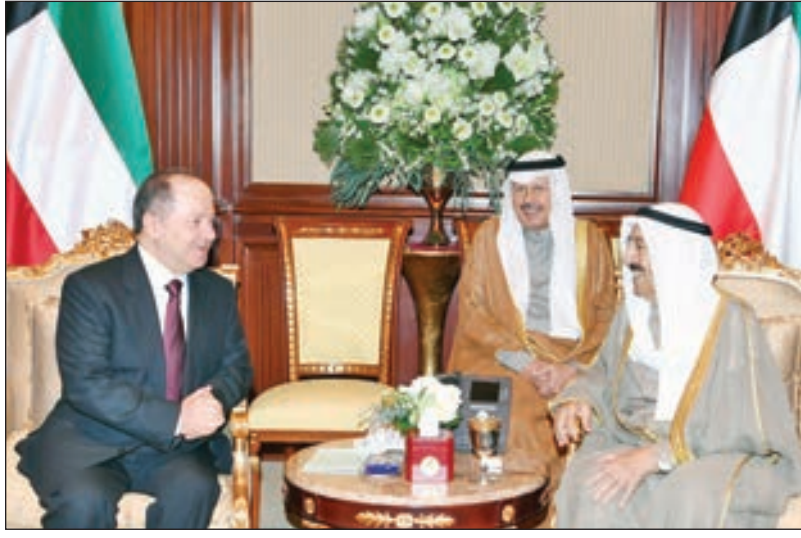
• صاحب السمو خلال استقباله مسعود بارزاني