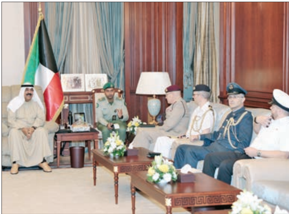
• الشيخ مشعل الأحمد مستقبلاً الوفد البريطاني