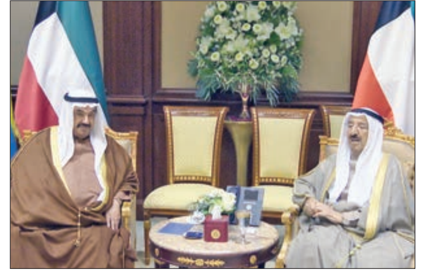
• سمو أمير البلاد مستقبلاً سمو الشيخ ناصر المحمد