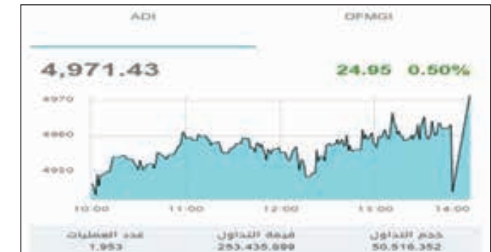
• مؤشر أبوظبي

0.48% بعد ان صعد سهم أبوظبي التجاري وأبوظبي الأول والاتحاد الوطني بنسبة 1.62% ، و0.42% ، و0.21% على الترتيب . وفي المقابل هبط قطاع الطاقة بنسبة 2.5% مدفوعاً بهبوط سهمي «دانة غاز» و«طاقة» بنسبة 3.98% ، و3.92% على الترتيب . وكان سهم أبوظبي الأول الأنشط تداولاً من حيث القيمة بنحو 155.32 مليون درهم، ومن حيث الحجم بنحو 10.78 ملايين سهم .