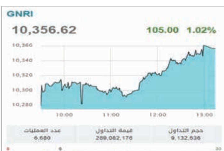
• مؤشر قطر

واصلت بورصة قطر ارتفاعاتها منبهة تعاملات أمس بالمنطقة الخضراء، وسط ارتفاع جماعي بالقطاعات، وتحسن بالتداولات . وسجل المؤشر العام نمواً نسبيته 1.02% صاعداً إلى النقطة 10,356.62، ليصبح 105.00 نقطة عن مستويات أول من أمس وانتعشت التداولات أمس حيث صعدت السيولة إلى 289.08 مليون ريال، مقابل 82.22 مليوناً أول أمس وارتفعت أحجام التداول عند 9.12 ملايين سهم، مقارنة بـ 2.90 مليون سهم في الجلسة السابقة . وشهدت الجلسة نمواً جماعياً للقطاعات بينها العقارات