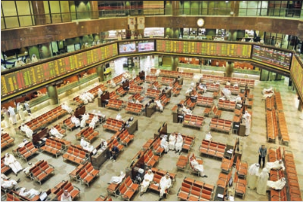
المؤشرات الكويتية تنهي التعاملات على تباين

وقال المحلل الفني لسوق المال، بدار الجدر: «إن المؤشرات الكويتية نحتت عند الإغلاق في تقليص خسائرها الصباحية بل استطاع مؤشر السوق الأول في التحول إلى اللون الأخضر؛ ما يعطي إشارة للتمسك نوعاً ما تأهباً لارتداد قريب قائم. وأوضح الجدر أنه على الرغم من تقليص المؤشرات خسائرها الصباحية في الختام، إلا أن تناقص وتيرة التداولات كانت سمة جلسة أمس، موضحاً بأن تراجع التداولات مؤشر إيجابي لأنه انخفاض صاحب تبايناً؛ ما يعني تمسك غالبية المتداولين بالأسهم في الوقت الحالي».