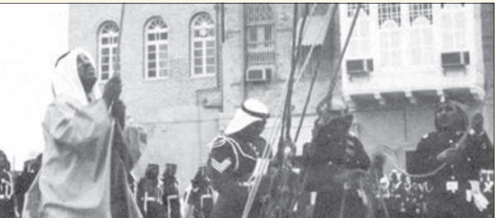
• الشيخ سعد العبدالله يرفع العلم الكويتي الجديد في 24 نوفمبر 1961 على البندرية بقصر السيف

علم دولة الكويت الحالي «علم الاستقلال» يطوي اليوم 57 عاماً على ذكرى رفعه للمرة الأولى على الوزارات والمؤسسات والدوائر الحكومية الرسمية مدشناً بذلك حقبة جديدة من تاريخ الكويت المعاصر. وشهد علم الكويت الرسمي مراحل تغير عديدة إلى أن اعتمد بشكله الحالي بصور المرسوم الأميري بهذا الشأن في 7 سبتمبر 1961 ليرفع على صواري المؤسسات والدوائر الحكومية في 24 نوفمبر 1961 للمرة الأولى في مراسم احتفالية مهيبه عمت البلاد.