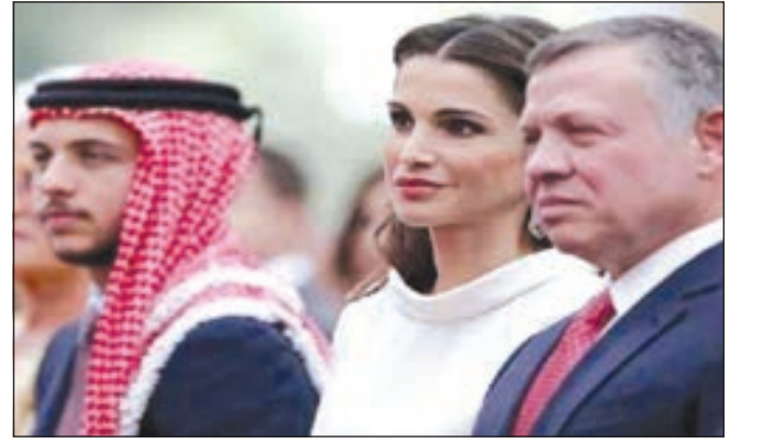
• الأمير الحسين مع والديه

أفادت وكالة الأنباء الأردنية «بترا» بصور قرار ملكي بترقية ولي العهد الأردني الأمير الحسين بن عبدالله الثاني لرتبة ملازم أول في القوات المسلحة الأردنية.