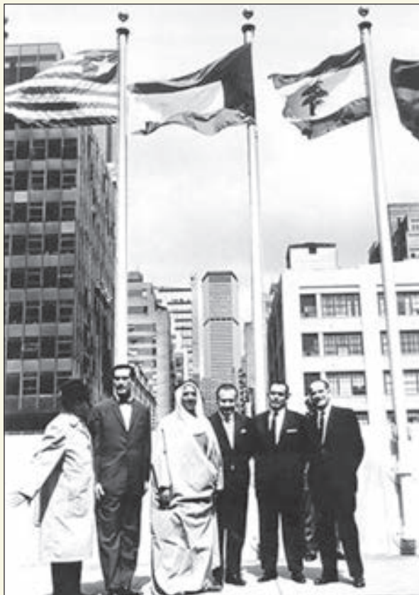
• سمو أمير البلاد حين كان وزيراً للخارجية بعد رفع علم الكويت أمام مبنى منظمة الأمم المتحدة في 14 مايو 1963

استوحيت ألوان علم الكويت من بيت شعر لصفي الدين الصلي «وإنا لقوم أيت أخلاقنا كرما - أن نبتي بالأنى من ليس يؤذينا - بيض صناعنا سود وقانعتنا - خضر مرايعنا حمر مواضينا». واتخذ علم الكويت قديماً أشكالاً عدة رفعت بصفة رسمية وغير رسمية وكانت تحمل في جها اللون الأحمر مصحوبة بكلمة «كويت» وبعض الدلالات ذات الطابع الإسلامي وصولاً إلى العلم الحالي ذي الألوان الأربعة الأخضر والأبيض والأحمر والأسود.