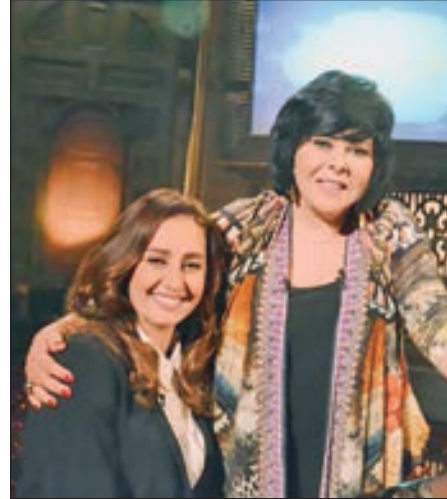
• حلا شيحة وشقيقتها

في أول ظهور لها على القنوات الفضائية بعد قرأها خلع الحجاب والعودة إلى عالم الفن، أكدت الفنانة حلا شيحة أنها توقعت غضب البعض، ولكنها صدمت من الهجوم الضاري والمتواصل والمبالغ فيه من الجمهور، وقالت أنها لا تحتاج أن تتردد قراراتها الشخصية لأحد طالما أنها مقتنعة بها، لافتة إلى أنها لم تجبر على ارتداء الحجاب أو على خلعها، ولديها أسباب تخصها.