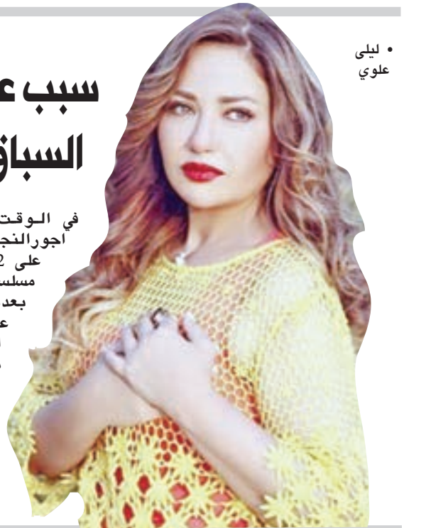
• ليلي علوي

في الوقت الذي طالبت فيه التخفيضات معظم اجورالنجوم أصرت الفنانة ليلي علوي الحصول على 12 مليون جنيه مقابل مشاركتها ببطولة مسلسل درامي جديد وافقت على تقديمه مؤخراً بعدما قرأت السيناريو وافقت مع المنتج على تقديمه إلا ان الرقم الذي طلبته تعدى السقف المحدد للأجور.