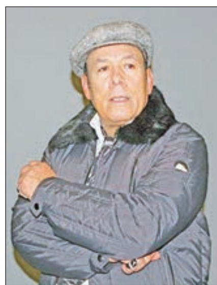
• أحمد مامر

الصورة نفسها تم تسريبها منذ شهر قليلة، للترويج لشائعة زواج ياسمين صبري من رجل أعمال خليجي معروف، وظهرت الفنانة المصرية لاحقاً ونفت زواجها سراً، كما تجاهلت أنباء زواجها من المدون الكويتي الشهير، ولم تعلق حتى الآن على طلب الفنان الكويتي عبدالله بهمن الارتباط بها.