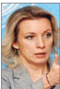
• ماريا زاخاروفا

عبرت المتحدثة الرسمية باسم وزارة الخارجية الروسية ماريا زاخاروفا عن أسفها لإطلاق الولايات المتحدة حملة تضييق أثناء انتخابات رئيس الإنترنت. وأضافت زاخاروفا خلال مؤتمر صحفي أمس: «تزامنت فترة ما قبل الانتخابات لحملة غير مسبقة من التضييق والضغط والتشهير، وأطلقت هذه الحملة للأسف بمبادرة من الولايات المتحدة ضد المرشح الروسي». وأضافت زاخاروفا أن الخارجية عالنية بمنع انتخاب المرشح الروسي، مشيرة إلى أن هناك تدخلاً فادحاً في الشؤون الداخلية للمنظمة الدولية، مؤكدة أن موسكو تعتبر مثل هذه الأفعال غير مقبولة وتضر ببيئة ومصادقة الإنترنت.