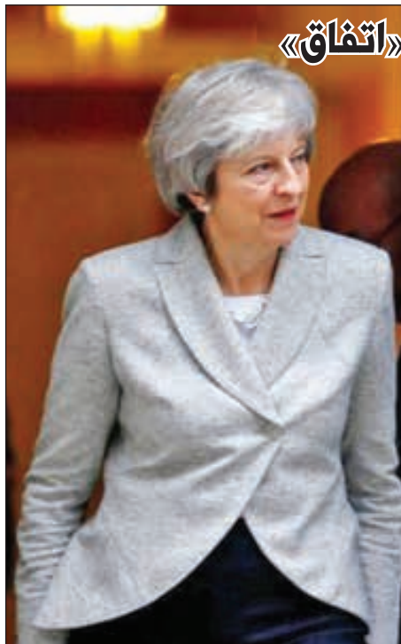
• تيريزا ماي كما بدت أمس

تخيم أجواء من التفاؤل على بريطانيا، للخروج من الاتحاد الأوروبي رغم الأجواء «المتشائمة» من احتمال مواجهة صعوبات أمام اتفاق «بريكسيت». وأعربت رئيسة الوزراء البريطانية تيريزا ماي أمس عن ثققتها باعتماد المجلس الأوروبي مسودة اتفاق خروج المملكة المتحدة من الكتلة الأوروبية خلال اجتماعه الخاص المزمع عقده الأحد المقبل. وأكدت ماي أن المحادثات التي أجرتها في بروكسل مع رئيس