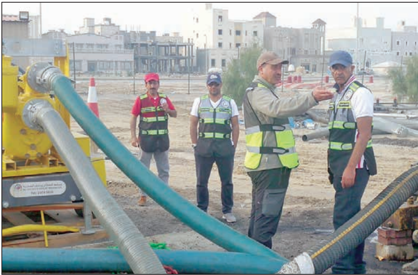
• وزير الأشغال حسام الرومي أثناء جولة تفقدية أمس

• «الداخلية»: مستعدون لكل البلاغات... ووزير الأشغال حسام لتفعيل خطة الطوارئ