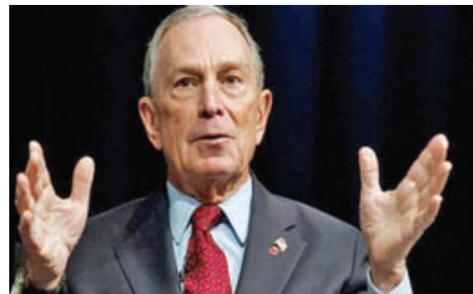
• مايكل بلومبرغ

نكافي الأشخاص على أساس جودة عملهم وليس على حجم محافظتهم». لافتاً إلى أن دراسته جرى تمويلها من خلال قرض ووظيفة في الحرم الجامعي.