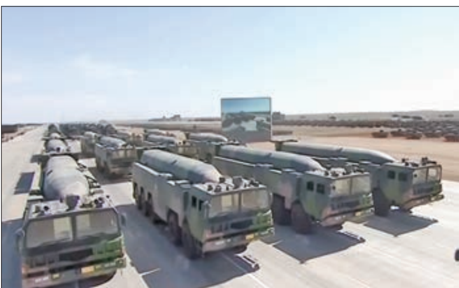
• قنابل نووية صينية

والتقني والعملياني، بما في ذلك حساب معادلات الحرارة والضغط في مركز الانفجار النووي، دون اللجوء إلى الحاسوب الذي يكن موجوداً آنذاك. وتكريماً لإنجازاته العلمية المنقطعة النظير، قامت الحكومة الصينية بمنحه أعلى جائزة علمية في البلاد، عام 2014، كما منحته أرفع وسام عسكري عام 2017.