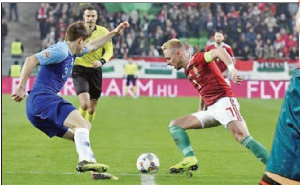
• لاعب المجر يحاول المرور من دفاع فنلندا

وكان المنتخب الإستوني هبط إلى المستوى الرابع.