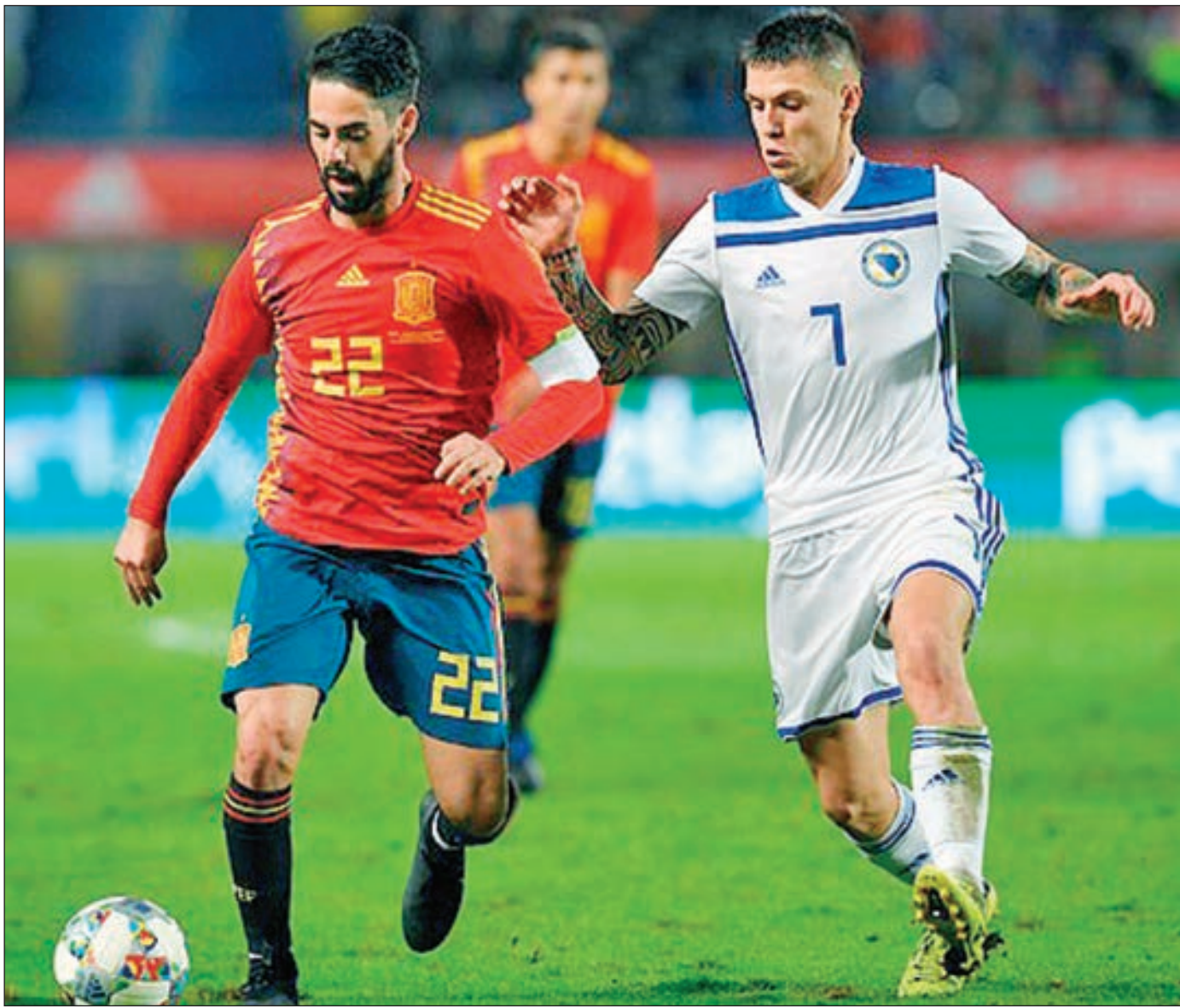
• إيسكو يمر من الدفاع ببراعة

الكرة أمام مينديز الذي وضعها في الشباك. واستمرت محاولات الماتادور المضاعفة للنتيجة، لكن دون أي جدوى، لتنتهي المباراة بالانتصار بهدف نظيف.