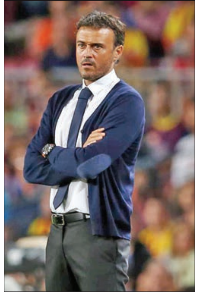
• لويس إنريكي

أكد لويس إنريكي، المدير الفني لمنتخب إسبانيا، أن لاعبي اللاروخا قدموا مباراة جيدة، خلال الفوز على البوسنة والهرسك بنتيجة 1-0، بالمباراة الودية التي جمعت المنتخبين مساء أول أمس الأحد.