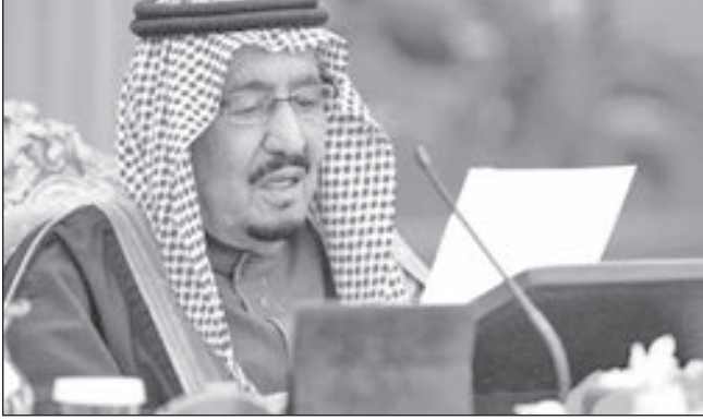
• الملك سلمان بن عبدالعزيز

قال الملك سلمان بن عبدالعزيز في خطابه بمجلس الشورى أمس: إن المملكة تدعم جهود الأمم المتحدة لإنهاء الحرب في اليمن وإن جلالته يؤكد الدعم للوصول إلى حل سياسي وفقا لقرار مجلس الأمن رقم 2216 والمبادرة الخليجية ومخرجات الحوار اليمني. وكان رئيس اللجنة الثورية العليا في اليمن محمد الحوثي أعرب عن الاستعداد لوقف العمليات العسكرية «في كافة الجبهات» وذلك إذا كان تحالف العدوان يريد السلام. وأعلن مبعوث الأمم المتحدة إلى اليمن مارتن غريفيث في وقت سابق أن المنظمة الدولية تلقت تأكيدات بحضور أطراف الصراع مؤتمراً تعقده للتوصل لحل سلمي للأزمة المتفاقمة في اليمن. وأضاف الملك السعودي خلال افتتاح أعمال السنة الثالثة من الدورة السابعة لمجلس الشورى السعودي: أن المملكة تدعو إلى حل سياسي يخرج سوريا من أزمتها بعيدا عن المنظمات الإرهابية والتدخلات الخارجية. وإذ أكد أن القضية الفلسطينية ستظل القضية الأولى للمملكة، دعا الملك سلمان المجتمع الدولي لوضع حد لبرامج إيران النووية والصاروخية الباليستية. وأشاد الملك سلمان «بالقضاء والنيابة العامة لقيامهما بمهامهما في خدمة العدالة» في إشارة منه إلى قضية مقتل الصحافي السعودي جمال خاشقجي. وهذه هي أول تصريحات علنية للعاهل السعودي منذ مقتل الصحافي جمال خاشقجي الشهر الماضي، الذي أثار غضبا عالميا، وأسفر عن تأزم علاقات الرياض مع الغرب، وفقا لوكالة رويترز. وختتم الملك كلامه بالقول: إن السعودية ترمي بتطور تنموي شامل، وفقا لخطة وبرامج رؤية المملكة 2030 التي وضعها ولي