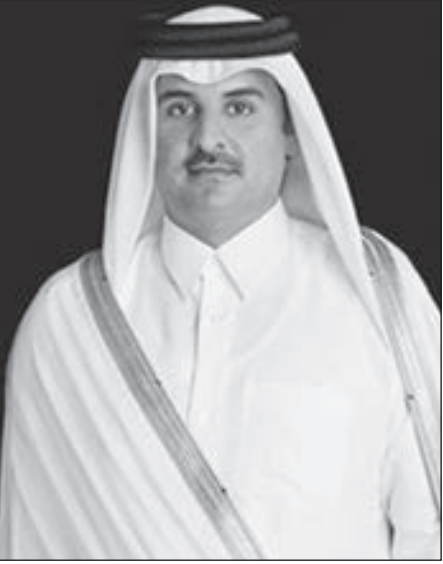
• سمو الأمير تميم بن حمد

غادر سمو الشيخ تميم بن حمد آل ثاني أمير قطر ظهر أمس متوجها إلى جمهورية كرواتيا في زيارة رسمية تستغرق يومين، يرافق سموه وفد رسمي، وقد وصل سموه إلى العاصمة زغرب مساء أمس وكان في استقبال سموه والوفد المرافق في مطار زغرب فرانجوتومان، داريو ميهايلين مستشار رئيسة الجمهورية للشؤون الخارجية والأوروبية، و ناصر بن حمد مبارك ال خليفة سفير قطر لدى كرواتيا، ودرافغو لوفريتش سفير جمهورية كرواتيا لدى الدولة، و إيفانا سيكوفيتش مساعدة وزيرة الشؤون الخارجية والأوروبية، والسادة أعضاء السفارة القطرية. وقالت وكالة الأنباء القطرية «قنا» إن زيارة الأمير إلى كرواتيا تتبعها أخرى إلى إيطاليا، مشيرة إلى أن الزيارة الأولى تأتي تلبية لدعوة الرئيسة الكرواتية كوليندا غرابار كيتاروفيتش، بالإضافة لدعوة مماثلة من نظيره الإيطالي سيرجيو ماتاريلا.