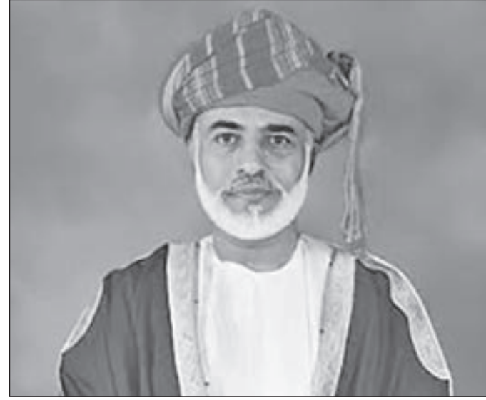
• السلطان قابوس بن سعيد

نشاجات كبيرة جداً في مجالات التنمية والاقتصاد والاستثمار والاستقرار السياسي والأمني وفي علاقاتها الخارجية، كان دورها الكبير لصانع القرار العماني المتمثلة في السلطان قابوس وحكمة فريقه الذي يحيط به وكان منسجماً وملتبصاً مع توجهات السلطان قابوس»، لافتاً إلى أن «عمان تعتبر في مقدمة الدول العربية ودول المنطقة، ونظراً لا يأتي من اقتصادها ولا يأتي من مواردها ولا يأتي من قوتها العسكرية، إنما يأتي من القدرة السياسية التي توفر لها والتي وفرها لها السلطان قابوس بن سعيد».