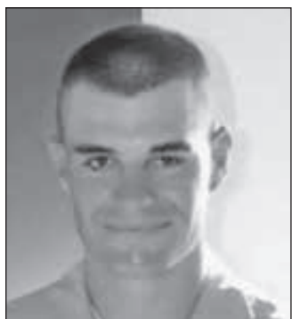
• إيان لونغ

وأضاف أن مثل هذه التعليقات: «تؤكد رواية كاذبة، ومدمرة» بأن المحاربين القدامى محطون وخطرون. لكن، أكثر الذين يعانون من اضطراب ما بعد الصدمة، عندما يصلون على علاج فعال، يقدرتون على أن يعيشوا حياة صحية، وسعيدة، وهادئة». وقال: «نحن ننفذ 20 من قدامى المحاربين بسبب الانتحار كل يوم». في الجانب الآخر، قال خبراء إن تفسير ترمب يمكن أن يكون صحيحاً، لكنه ليس تفسيراً كاملاً. وقالت كايل ويليامز، ضابط سابقة في القوات البرية، والأخصائية العسكرية في مركز «نيو أميركان سيكويريتي» «مركز أمن أميركا الجديد» «ليست غير مفيدة أبداً».