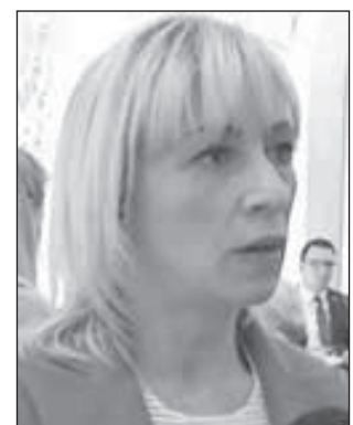
• ماريا زاخاروفا

موسكو تابعة لقرارات مجلس الأمن الدولي لذلك فهي تتخذ قرارها بما يتلاءم مع مصالحها القومية. وتابعت ان الدول التي تمارس الحظر الاحادي هي غالباً ما تتشدد بحقوق الانسان والتنمية الاقتصادية والديمقراطية ولكنها بعيدة عن هذه التصورات معتبرة الحظر الاحادي ضد ايران انتهاكاً صارخاً للقوانين والعلاقات الدولية مشيرة الى الموقف الروسي حيالها مضيفة ان هذا الموقف لا يقتصر على ايران فحسب بل ان روسيا تعتبر فرض حظر احادي على اي دولة مخالفاً للقوانين ولا تتلزم به. وأضافت الناطقة باسم وزارة الخارجية الروسية ان الاجراء الأميركي يستهدف اتفاقاً دولياً صادق عليه مجلس الامن الدولي وان الولايات المتحدة وبخروجها من الاتفاق النووي تقوض جميع المساعي التي بذلتها اطراف الاتفاق وهي الاتحاد الأوروبي وموسكو وبكين وغيرهم مؤكدة ان تقييمنا للاجراء الأميركي سلبي.