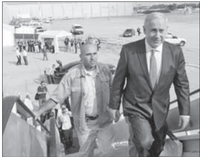
• رئيس وزراء الاحتلال الإسرائيلي يقطع زيارته إلى باريس

وما زالت الرقابة العسكرية الإسرائيلية» تفرض حظراً شاملاً وكاملاً على تفاصيل العملية التي نفذتها قوة مختارة ونخبوية من جيش الاحتلال الإسرائيلي في الساعات المتأخرة من ليلة الأحد في عمق الأراضي الفلسطينية في قطاع غزة، والتي أسفرت عن استشهاد سبعة فلسطينيين، ومقتل ضابط إسرائيلي برتبة عميد. وحتى اللحظة لم تسمح الرقابة العسكرية بنشر تفاصيل الضابط القتيل والآخر الذي أصيب بجراح متوسطة خلال تبادل إطلاق النار مع المقاومة الفلسطينية، وتم نقله إلى مستشفى «سوروكا» في مدينة بئر السبع بجنوب فلسطين المحتلة.