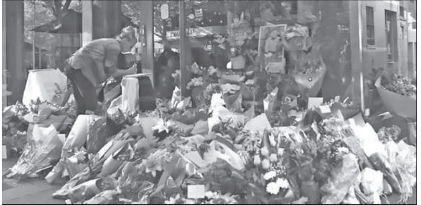
• باقات من الورود في مكان اعتداء ملبورن

قال بيتر داتون وزير الداخلية الأسترالي أمس إن من رغم الإجراءات الأمنية المشددة في أعقاب هجوم وقع في ملبورن الأسبوع الماضي يستلمه نهج تنظيم داعش الإرهابي. وكان رجل صومالي المولد أشعل النار في شاحنة صغيرة محملة باسطوانات غاز في وسط ثاني أكبر مدن استراليا يوم الجمعة قبل أن يلعن ثلاثة أشخاص ما أسفر عن مقتل رجل يبلغ من العمر 74