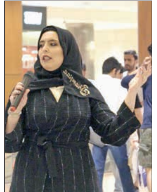
الشبيخة مريم الصباح