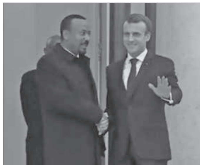
• إيمانويل ماكرون وأبي أحمد

اهتمام خاص له، وستواصل كل من إثيوبيا وفرنسا جهودهما من أجل تعزيز السلام والأزدهار في المنطقة، لا سيما من خلال مساهمتهما في نجاح بعثة الاتحاد الأفريقي في الصومال «أميسوم»، وتعزيز قدرات القوات الصومالية، وتحقيق الاستقرار في جنوب السودان في أعقاب اتفاقية السلام المجددة التي تم توقيعها في 12 سبتمبر 2018 في أبيس أبابا. التي أطلقها الدكتور أبي أحمد، في إطار دعم الانفتاح الاقتصادي لإثيوبيا. وتعلن فرنسا استعدادها للنظر في طرق محددة لتنفيذ برامج دعم الوكالة الفرنسية للتنمية، من أجل مراعاة القيود التي تواجهها إثيوبيا فيما يتعلق بميزان المدفوعات والوصول إلى العملة الأجنبية. وتلتزم فرنسا بتعزيز فرص الاستثمار وتنمية الأنشطة الاقتصادية في إثيوبيا تجاه القطاع الخاص الفرنسي، وتلتزم إثيوبيا بتسهيل عمل الشركات الفرنسية في إثيوبيا وتشجيع بيئة مواتية لتنمية القطاع الخاص.