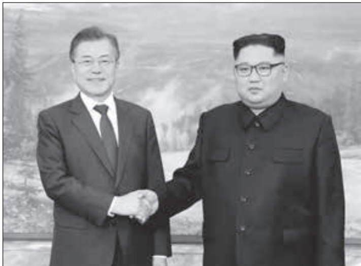
• زعيما كوريا الشمالية والجنوبية

بينهم تشون هي سونغ نائب وزير التوحيد، وسوه هو، كبير مستشاري الرئيس لشؤون التوحيد. ويواجه كيم ضغوطاً دولية مستمرة، بسبب برامج الأسلحة في بلاده. وقد تعهد باتخاذ خطوات لنزع السلاح النووي خلال قمة تاريخية جمعته في يونيو بالرئيس الأميركي دونالد ترامب في سنغافورة، لكن الخطوات التي اتخذتها بيونغ يانغ حتى الآن لم تف بالمطالب الأميركية التي تشمل اتخاذ خطوات غير قابلة للتراجع عنها، للتخلص من ترسانتها والإفصاح الكامل عن منشآتها وموادها النووية. وتسببت العقوبات الدولية، وأخرى مفروضة من جانب واحد في الحد من نطاق التعاون بين الكوريين، إذ أنها تحظر العديد من أشكال التعامل الاقتصادي مع الشمال. لكن الكوريين نفذتا عدداً من الإجراءات، بهدف تخفيف حدة التوتر بينهما بما شمل المشاركة في منافسات رياضية وفعاليات ثقافية، وإغلاق بعض مواقع حرس الحدود بينهما، إضافة لإجراء مفاوضات على مستوى رفيع.