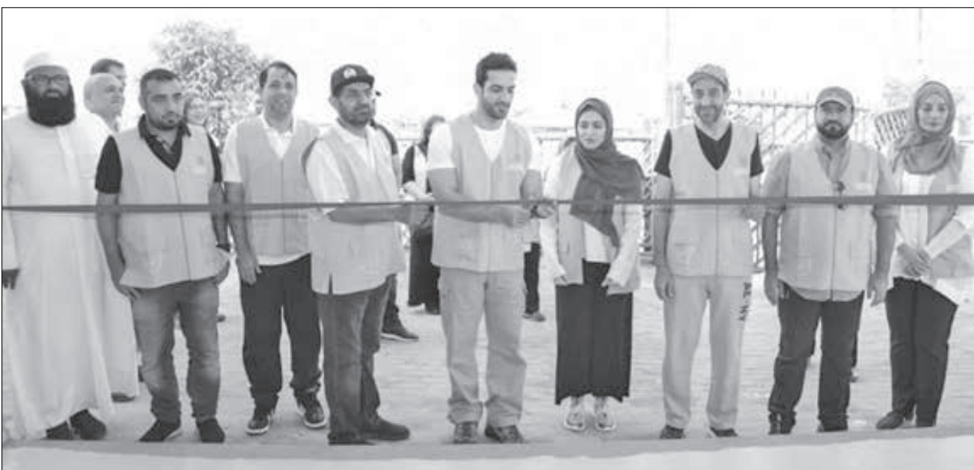
• جانب من افتتاح المستشفى

والرعاية الأولية للاجئين بما في ذلك الصحة الإنجابية وتحسين فرص الحصول على الرعاية الصحية الجيدة للأمهات والأطفال، من خلال توفير خدمات التوليد الطارئة ورعاية المواليد الجدد وخدمات علاج العنف الجنسي بفرق طبي وإداري وتوعوي من منظمة أطباء بلا حدود إلى جانب الكادر المحلي من المواطنين البنغاليين ولاجئي الروهينغا. وتفقد الشيخ سلطان بن أحمد القاسمي والوفد المرافق له عقب الافتتاح أقسام المستشفى واستمع إلى شرح حول الخدمات الطبية التي يقدمها المستشفى.