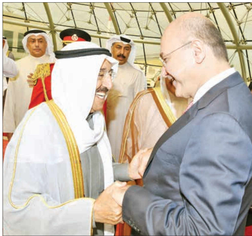
• صاحب السمو لدى استقباله الرئيس العراقي أمس

وثنم سموه المتابعة الحثيئة لرئيس مجلس الوزراء سمو الشيخ جابر المبارك وأخوانه الوزراء لهذا الحدث واتخاذ كل ما يلزم من أجل الحفاظ على سلامة المواطنين.