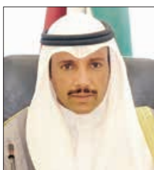
• مرزوق الغانم

الحصى مرتبط بعقود موقعة منذ فترة زمنية طويلة، وقد وعدنا وزير الأشغال بحلها.