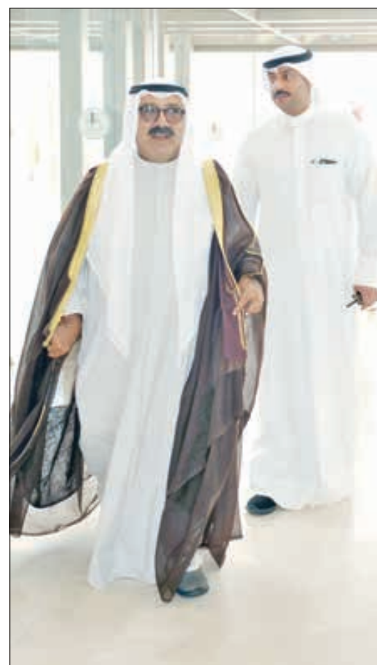
• الشيخ ناصر الصباح لدى وصوله إلى مجلس الأمة

عبر النائب الأول لرئيس مجلس الوزراء وزير الدفاع الشيخ ناصر الصباح عن سعائه بأن يكون مع النواب في هذه الفترة المزدهرة، وذلك في رده على ترحيب رئيس مجلس الأمة مرزوق الغانم بعودته للبلاد معافي من رحلة العلاج.