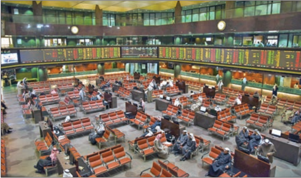
• السيولة الأسبوعية تراجعت إلى 62.5 مليون دينار

ارتفعت المؤشرات الرئيسية لبورصة الكويت بنحو جماعي خلال الأسبوع الماضي، وسط تباين بالتداولات. وسجل مؤشر السوق الأول نمواً نسبته 0.69% ليبلغ الإجمالي الماضي عند النقطة 5299.28، رابحاً 36.42 نقطة عن مستويات الأسبوع السابق عند 5262.86 نقطة. وزاد مؤشر السوق الرئيسي 0.66% ليصل إلى النقطة 4749.08، ليكسب 31.04 نقطة عن مستويات الأسبوع الماضي المنتهي في 1 نوفمبر. وبشأن مؤشر السوق العام فقد ارتفع 0.68% ليتهيئ التعاملات عند النقطة 5103.87، رابحاً 34.51 نقطة عن الأسبوع الماضي. يشار إلى أن بورصة الكويت شهدت في الأسبوع الماضي 4 أيام عمل فقط: نظراً لإغلاق التداولات يوم الثلاثاء الماضي بسبب سوء الأحوال الجوية والأمطار الغزيرة. وسجلت القيمة السوقية للأسهم الكويتية 28.9 مليار دينار، مقارنة بـ 28.7 مليار دينار في الأسبوع الماضي، بنمو 0.7%. وخلال الأسبوع الماضي، تراجعت السيولة بنسبة 10.9% إلى 62.5 مليون دينار، مقابل قيمتها في الأسبوع السابق عند 70.2 مليون دينار. وعلى الجانب الآخر ارتفعت أحجام التداول إلى 529.9 مليون سهم، مقارنة بـ 365.6 مليون