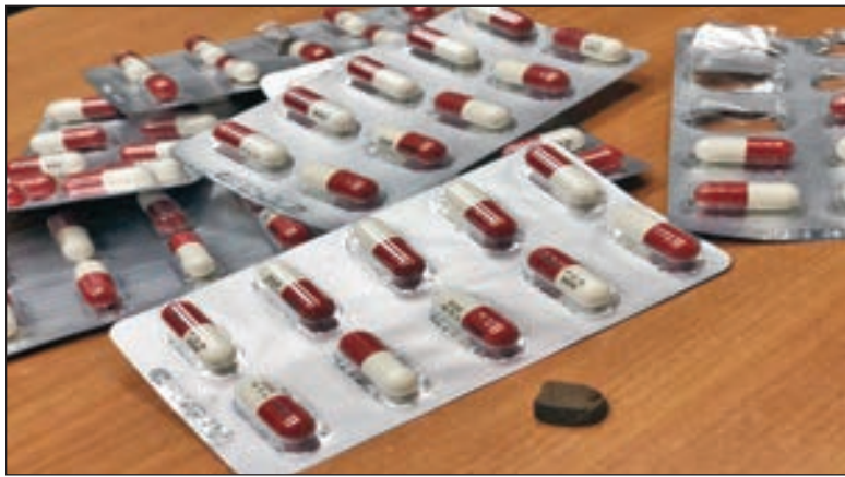
• جانب من الحبوب المخدرة

وتمن المطر جهود رجال الجمر كويتي في حماية البلاد من كل محاولات تهريب المواد المخدرة والمحتظرة.