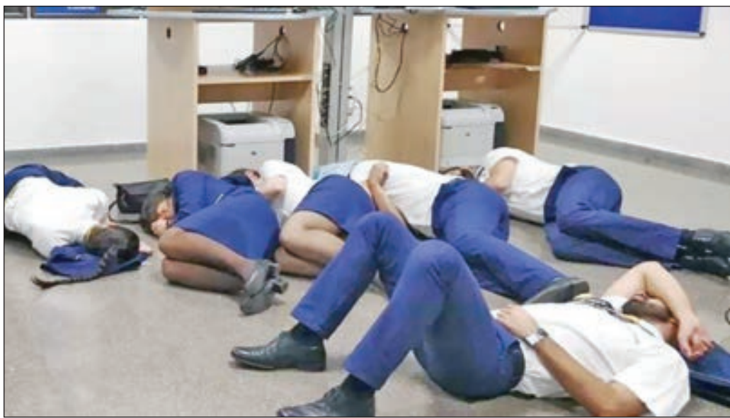
• الموظفون المطرودون نامون في المطار

لكن الأمر لم ينته هنا، إذ استمر رواد مواقع التواصل الاجتماعي بإعادة نشر الصورة، مع إرفاق عبارات انتقاد لأذعة لشركة الطيران.