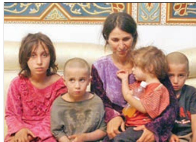
• مختطفة من ريف السويداء تم تحريرها مع أبنائها

وقال مسؤول اميركي كبير في مجال مكافحة الإرهاب «نحن نقول للحكومات الأوروبية: استعيدوا مواطنيكم وحاكموهم... فهم أخطر عليكم هنا منهم عند عودتهم للوطن». وترفض أوروبا في أكثر الأحيان حيث لا يوجد تعاطف.