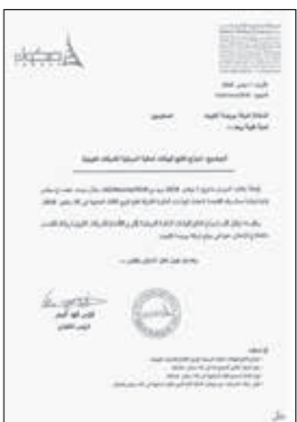
• نموذج بيانات «صكوك»

أظهرت البيانات المالية لشركة صكوك القابضة، تحولها لتحقيق الخسائر بالربع الثالث من العام الحالي، مقارنة بأرباح الفترة المماثلة من العام الماضي. وأوضحت الشركة في بيان للورصة الكويت، أمس، أن صافي الخسائر للفترة بلغ 4.83 ملايين دينار، مقابل 1.75 مليون دينار بالفترة المماثلة من العام الماضي. وعزت الشركة التحول للخسائر إلى خسائر شركات زميلة،