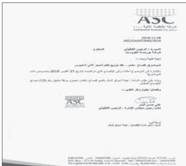
• إفصاح «الأنظمة»

أعلنت شركة الأنظمة الآلية أنه بناءً على طلب هيئة أسواق المال: فإن إجمالي إيرادات الشركة من عقد توزيع نظام الحجز الآلي «أماديوس» بلغت 5.05 ملايين دينار 16.67 مليون دولار بنهاية السنة المالية 2017. وتابعت الشركة في بيان لبورصة الكويت أمس، أنها تقوم حالياً بإجراءات التقييم الكامل لتأثير اختيار أماديوس شريكاً جديداً، على أن تعلن الشركة عن تأثير ذلك الإجراء في البيانات المالية لسنة 2018. وفي بيان منفصل، لفتت «الأنظمة» إلى أن مجلس الإدارة سيجتمع في 15 نوفمبر الحالي، لمناقشة البيانات المالية للربع الثالث المنتهي في 30 سبتمبر 2018. وكانت الشركة قد أعلنت في أكتوبر الماضي، أنه تم إخطارها رسمياً من قبل شركة أماديوس: باختيار الأخيرة شريكاً جديداً لتوزيع نظام الحجز الآلي الخاص بها في الكويت بدءاً من مطلع يناير المقبل: نظراً لإنهاء العقد الحالي في 31 ديسمبر 2018. وكانت الشركة قد أعلنت منتصف أكتوبر الحالي، توقيع عقد مع شركة الامتيازات الخليجية القابضة: