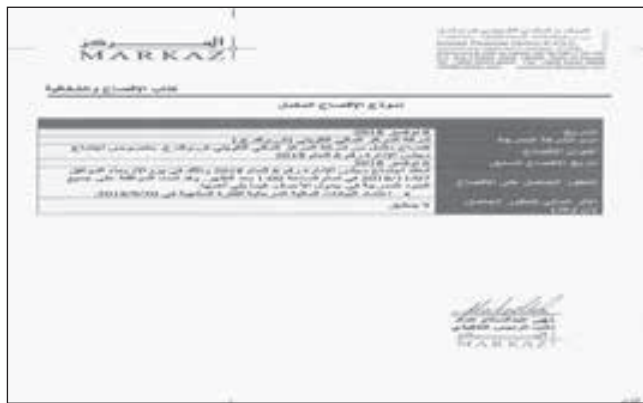
• إفصاح «المركز»

المصرفية الاستثمارية ارتفعت لتصل إلى 1.79 مليون دينار «نحو» 5.9 مليون دولار، وأن استثمارات الشركة حققت دخلاً بلغ 8.17 ملايين دينار «نحو» 26.96 مليون دولار، وعوائد بنسبة 10% على أساس سنوي. وذكر أنه بالنظر إلى سياسة المركز المتحفظة في تقييم الأصول تم احتساب مخصصات مجمعة بواقع 2.7 مليون دينار «نحو» 8.9 ملايين دولار، تعكس ظروف الدورة العقارية السائدة حالياً في بعض أسواق دول مجلس التعاون الخليجي.