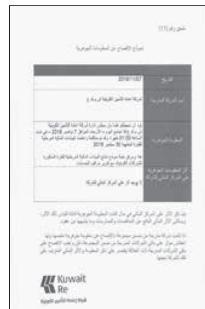
• نموذج الإفصاح لـ «إعادة»

أوضحت البيانات المالية لشركة إعادة التأمين الكويتية «إعادة»، ارتفاع أرباح الربع الثالث من العام الحالي بنسبة 10.8% على أساس سنوي. وبحسب نتائج الشركة للبورصة الكويتية، أمس، بلغت أرباح الفترة 1.05 مليون دينار 3.46 مليون دولار، مقابل أرباح بقيمة 944 ألف دينار 3.11 مليون دولار للربع الثالث من عام 2017.