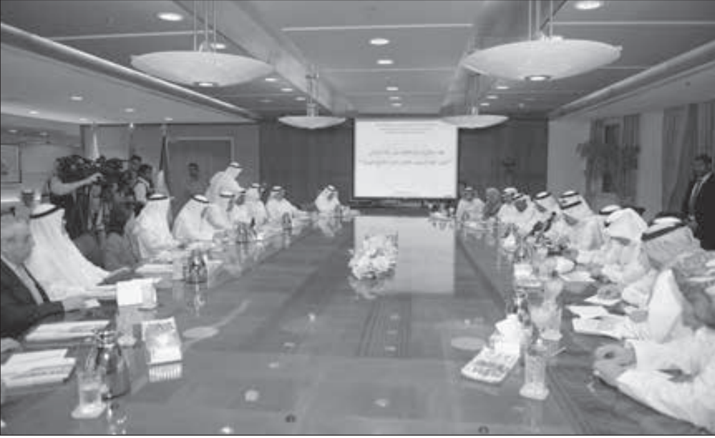
• جانب من الاجتماع الذي عقد بغرفة التجارة والصناعة

الاقتصادية الدولية. وقدم وفد الأمانة العامة المرافق للأمين العام عرضاً عن مسيرة مجلس التعاون ودور الأمانة العامة في صناعة السياسات واتخاذ القرارات، وكذلك إنجازات مسيرة مجلس التعاون في المجالات الاقتصادية والتجارية والتمنوية، وما تحققت من تكامل وترابط في تلك المجالات، والجهود التي يبذلها مجلس التعاون للحفاظ على مستويات عالية من التنمية البشرية، وزيادة النمو الاقتصادي واستدامته للدول الأعضاء في المجلس. كما تناول العرض أهم مشاريع التكامل الخليجي الاقتصادي والتنموي منذ صدور الاتفاقية الاقتصادية الموحدة، ودور هيئة الشؤون الاقتصادية والتنموية لدول المجلس، ومرتكزات عملها وبرنامجه لتحقيق الوحدة الاقتصادية الخليجية.