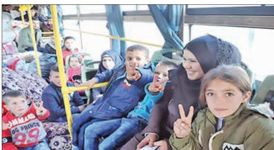
• أطفال مع عوائلهم يرفعون شارة النصر لدى عودتهم إلى سورية

وعادت أمس دفعات جديدة من المهجرين السوريين من الأراضي اللبنانية عبر معابر الدبوسية والزمراني وجديدة يابوس الحدودية في إطار الجهود المشتركة التي تبذلها الحكومة السورية بالتعاون مع الجانب اللبناني.