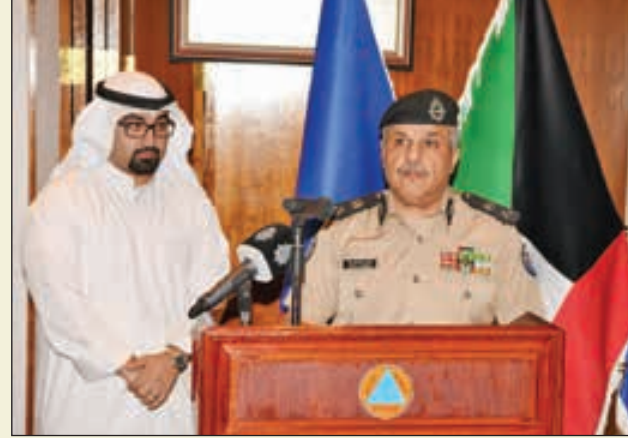
• الشيخ مازن الجراح متحدثاً

مجلس الوزراء ووزير الداخلية الفريق م. الشيخ خالد الجراح ووكيل وزارة الداخلية الفريق عصام النهام مؤكداً أن للعمل الشرطي دوراً مهماً في المجتمع وهو بسط مظلة الأمن والأمان والتحصدي للجريمة بكافة أشكالها وتطبيق القانون على الجميع.