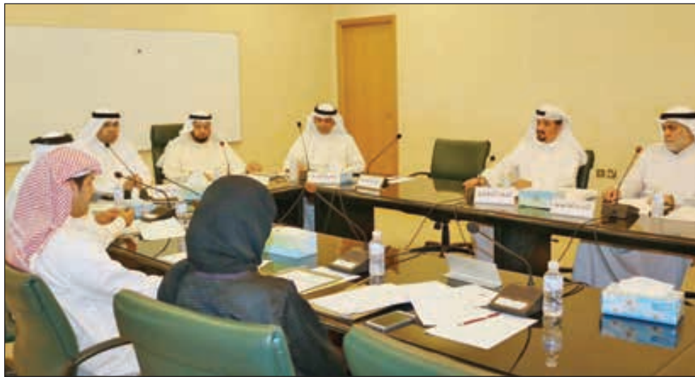
• جانب من اجتماع اللجنة

أوصت لجنة مزاولة المهنة الهندسية في المجلس البلدي بتشكيل لجنة لمراقبة الطرق السريعة يرأسها وزير الداخلية واستعمال هيئة الطرق في تنفيذ محطات وزن الشاحنات على الطرق الرئيسية والسريعة إضافة إلى توصيتها باستعمال وزارة الداخلية في توفير واستخدام الأوزان المتحركة.