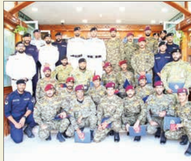
• المشاركون في الدورات

اختتمت إدارة الإطفاء البحري صباح أمس عدداً من الدورات التخصصية التي أقيمت لصالح منتسبي الحرس الوطني، وقد شارك في هذه الدورات عدد من الضباط وضباط الصف. وقال مدير إدارة الإطفاء البحري العقيد بدر الكدم بيان الإدارة اقامت عدداً من الدورات التخصصية في مجال الإنقاذ البحري وهي: الإنقاذ البحري التأسيسية وأسباب البقاء والمنقذ البحري والغوص بالمعدات والغوص الحر.