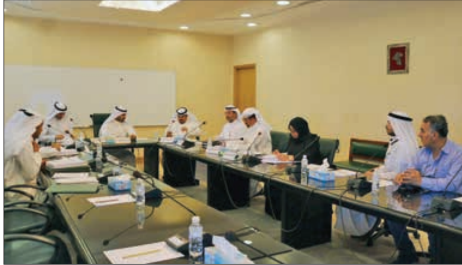
• خلال اجتماع اللجنة

وافقت لجنة محافظة الفروانية بالمجلس البلدي على طلب وزارة الأوقاف والشؤون الإسلامية بشأن توسعة المسجد المقررة ضمن منطقة جليب الشيوخ بمنطقة الاستعمالات الحكومية وعلى الطلب المقدم من وزارة الأشغال العامة تخصيص 12 موقعاً مقترحا بصفة مؤقتة لوحدات متنقلة لتنقية ومعالجة مياه الصرف الصحي ضمن منطقة جليب الشيوخ بالإضافة إلى موافقتها على الطلب المقدم لأهالي منطقة اشبيلية بإعادة مقترح عمل مدخل لمنطقة اشبيلية قطعة 4 وعلى طلب الهيئة العامة للطرق والنقل البري ترحيل جسر المشاة المخصص سابقا بين منطقتي خيطان والفروانية فوق طريق المطار بالموقع رقم 3 إلى موقع آخر بديل وذلك لتفادي التعارض بين جسر المشاة المقترح وجسور السيارات القائمة بنفس المنطقة.