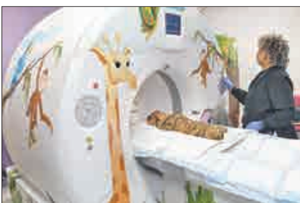
• فحص الطفلة الفرعونية بالأشعة