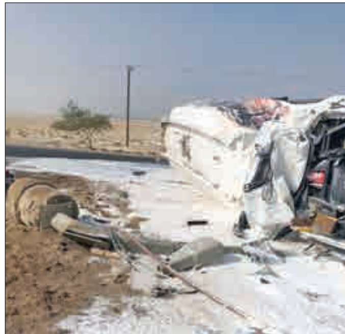
• الصهرج متقلباً على الطريق