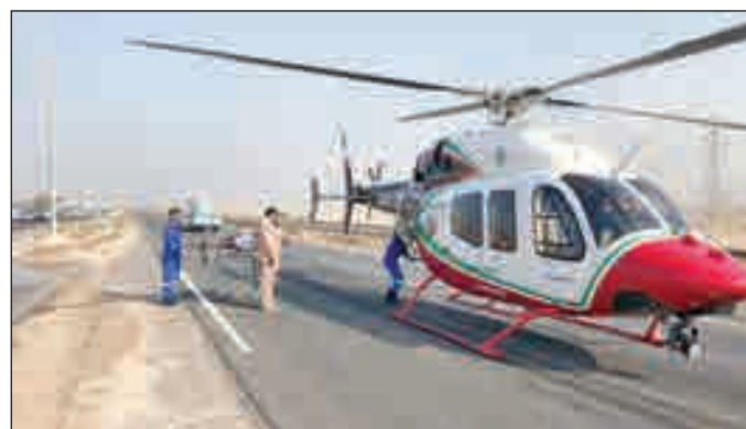
• الإسعاف الجوي في موقع الحادث

تعامل رجال الإطفاء مع حادث انقلاب صهرج ديزل على طريق الزور، حيث أسفر الحادث عن إصابة قائد الصهرج بإصابات متفرقة. وكان رجال إطفاء مركز الزور هرعوا الى موقع الحادث بقيادة رئيس المركز العقيد مشعل القطان وقاموا بإخراج قائد الصهرج وتسليمه الى فني الطوارئ الطبية، وقد نقل الى المستشفى عن طريق الإسعاف الجوي، فيما حاصر رجال الإطفاء الديزل المنسكب والذي قدرت حمولته بـ 5 آلاف غالون عن طريق استخدام مادة الفوم والرمل. وقد قامت الطوارئ الطبية بنقل المصاب بالإسعاف الجوي.