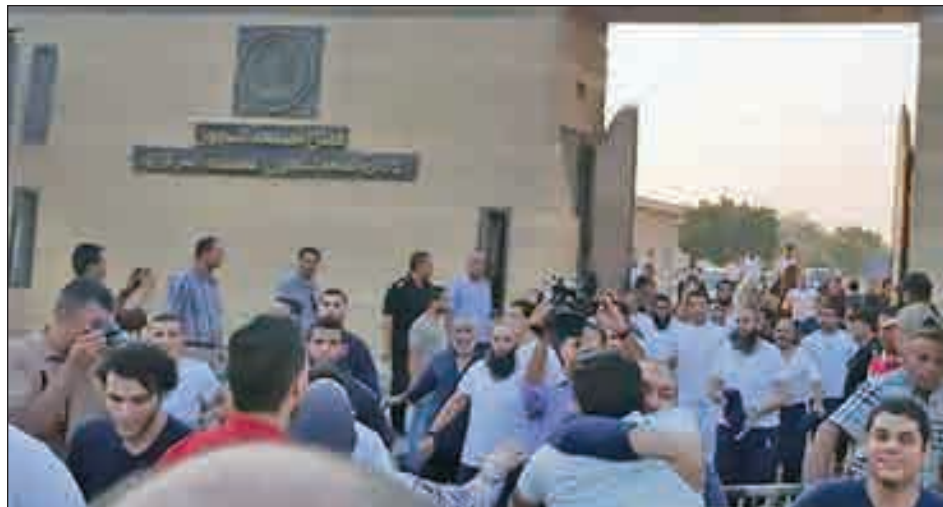
• السجناء يخرجون بعفو رئاسي

استكمالاً لتنفيذ قرار رئيس الجمهورية المصري عبدالفتاح السيسي الصادر بشأن الإفراج بالعفو عن باقي مدة العقوبة بالنسبة لبعض المحكوم عليهم بمناسبة الاحتفال بالذكرى السادس من أكتوبر، وأصل قطاع السجون المصرية عقد اللجان لفحص ملفات نزلاء السجون لتحديد مستحقي الإفراج بالعفو عن باقي مدة العقوبة. وانتهت أعمال اللجان إلى انطباق القرار على «332» نزيراً ممن يستحقون الإفراج عنهم بالعفو، وانتهت بالإفراج أيضاً عن «440» نزيراً لإفراجاً شرطياً، بإجمالي «772» مفرجاً عنهم. يأتي ذلك في إطار حرص وزارة الداخلية المصرية على تطبيق السياسة العقابية بمفهومها الحديث، وتوفير أوجه الرعاية المختلفة للنزلاء وتفعيل أساليب الإفراج عن المحكوم عليهم الذين تم تأهيلهم للانخراط في المجتمع.