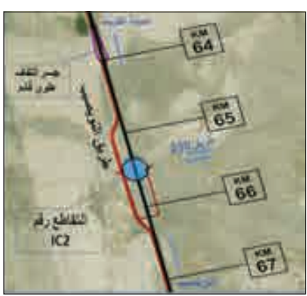
• مخطط يوضح مسار التحويلة

تفتتح الهيئة العامة للطرق والنقل البري في فجر غد الخميس التحويلة المرورية على طريق النويصيب بطول 2 كم تقريبا، حيث تبدأ من الكيلو 64.5 إلى الكيلو 66.5 تابع لعقد مشروع طريق النويصيب، وذلك بالتعاون مع الإدارة العامة للمرور.