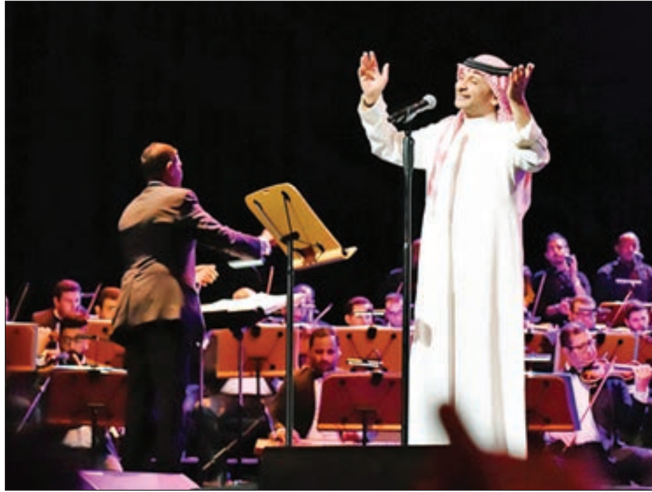
• عبدالمجيد عبدالله