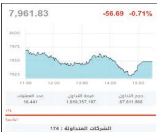
• مؤشر السعودية

أغلق المؤشر العام للسوق السعودي -تاسي- على ارتفاع بنهاية الأسبوع الماضي المنتهي الخميس، وسط ارتفاع أغلب القطاعات. وصعد «تاسي» بنسبة 1.03% لتعادل 81.09 نقطة، عند مستوى 7948.25 نقطة.