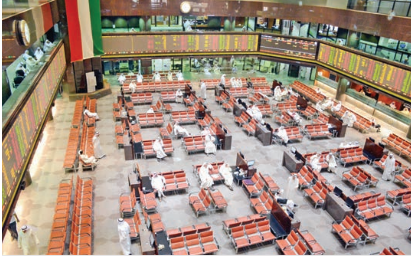
• تراجع المؤشر العام خلال الأسبوع 1.46%

اختتمت بورصة الكويت تعاملات الأسبوع الأخير من أغسطس الماضي، والذي جاء بعد إجازة عيد الأضحى، بإداء متباين على مستوى المؤشرات والتداولات. وتراجع المؤشر العام خلال الأسبوع 1.46% متدنياً إلى النقطة 5132.31 مقارنة بإقفال الأسبوع السابق عند 5208.54 نقاط، بخسائر أسبوعية تقدر بنحو 76.23 نقطة.