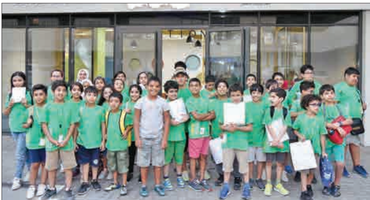
لقطة جماعية للأطفال المشاركين