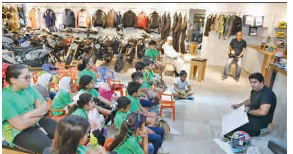
الأطفال يستمعون إلى شرح عن الدرجات الآلية

الدرجة. برنامج هذا العام تم بمشاركة مركز KIDSTOP الخاص بتنمية المهارات الفنية للأطفال.