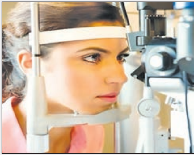
• اختبار للعين

مع زيادة خطر الإصابة بالأمراض الجلدية. وتتشعب مشاكل في أعضاء أخرى مثل هذه الحالة. ارتفاع مستوى الكوليسترول يدل ظهور حلقة باللون الأصفر الفاتح حول القرنية على وجود خلل في حرق الدهون، كما أن وجود نسبة عالية من الدهون في الدم يمثل خطراً على الصحة العامة، وعادة ما يرتبط ذلك