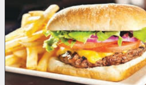
• مخاطر صحية للوجبات السريعة

وقالت أنجيلا دونين المعدة الرئيسية للدراسة لـ «رويترز هيث» في رسالة بالبريد الإلكتروني «الاستهلاك المتكرر للوجبات السريعة قد يزيد مخاطر