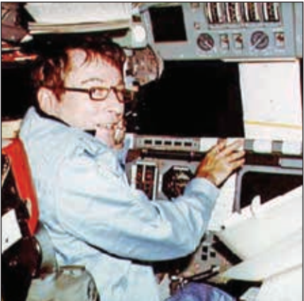
• جون يونغ

أعلنت إدارة الطيران والفضاء الأميركية «ناسا» وفاة رائد الفضاء الأميركي الشهير جون يونغ وذلك عن عمر ناهز الـ 87 عاماً في منزله بيهوستن في ولاية تكساس متأثراً بإصابته بمرض الالتهاب الرئوي. وقالت «ناسا» في بيان إن يونغ كان من رواد الفضاء المخضرمين فهو أول رائد فضاء يقوم بست رحلات كما تولى ست مهام في الفضاء منها مهمتان للهبوط على سطح القمر وتولى قيادة أول رحلة مكوك للفضاء. ونعى مدير «ناسا» روبرت ليمبوت يونغ قائلاً إنه «أمضى ثلاثة أجيال من الرحلات الفضائية وكان واحداً من مجموعة الرواد الأوائل الذين أطلقت شجاعتهم والتزامهم أول إنجازات أمتنا الكبرى في الفضاء». وقال الرئيس الأميركي الأسبق جورج دبليو بوش إن يونغ «كان أكثر من صديق طيب وهو وطني جسور ساعدت شجاعته والتزامه يواجه شعبنا على الدافع مرة أخرى بأفق الاكتشاف لأمتنا في وقت حرج».