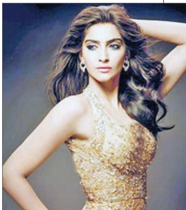
• سونام كابور

كشفت النجمة الهندية وملكة الجمال السابقة بريانكا شوبرا عن معاناتها من الاكتئاب مع انتهاء الاجازة بعد المرح والاحتفالات لمدة اسبوع. كانت الممثلة قد طارت الى الولايات المتحدة في وقت سابق من هذا الاسبوع، من أجل استكمال مهام تصوير الجزء الثاني من «كوانتيكو» سبب أزمته يتحمل في شعورها بالملل والضجر بعد العودة من السفر من الهندية وملكة الجمال السابقة بريانكا شوبرا عن معاناتها من الاكتئاب مع انتهاء الاجازة بعد المرح والاحتفالات لمدة اسبوع. كانت الممثلة قد طارت الى الولايات المتحدة في وقت سابق من هذا الاسبوع، من أجل استكمال مهام تصوير الجزء الثاني من «كوانتيكو» سبب أزمته يتحمل في شعورها بالملل والضجر بعد العودة من السفر من