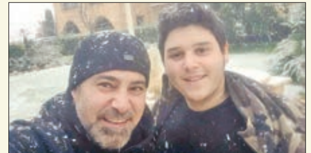
• عاصي الحلاني مع ابنته

خرج النجم اللبناني عاصي الحلاني في زهرة تلجئة مع ابنه الوليد في المغامرة التي يملكها فارس الغناء العربي في البقاع، إلا أنه لم يحرم الفنان من مشاركته أجواء زهرته الحلاني قرر الاستمتاع بالطبيعة الثلجية على طريقته الخاصة، حيث خاض مغامرة خطيرة بقيادة سيارته وسط الثلوج، وشارك محبيه بمقطع فيديو للمغامرة مربعا عن استمتاعه بها، وفي الوقت الذي أثنى الفنان على جرأة الفنان، حذر البعض الآخر من القيادة في هذه الظروف، معربين عن قلقهم على نجمهم المفضل. من ناحية أخرى، يستعد عاصي الحلاني لإحياء حفل غنائي ضخم ضمن فعاليات مهرجان ربيع سوق واقف 2017 في العاصمة القطرية الدوحة، وذلك يوم الاثنين الموافق 23 الحالي.