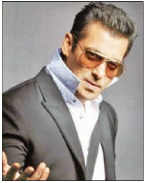
• سلمان خان