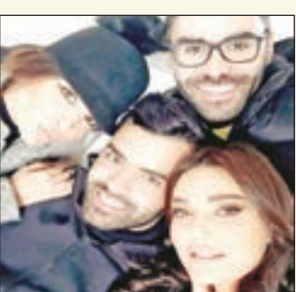
• سيرين عبدالنور في الإعلان

تستعد الفنانة اللبنانية سيرين عبدالنور للعودة إلى الأضواء بإعلان جديد بعد فترة غابت فيها عن الشاشة. سيرين شاركت الفنان بصورة لها من كواليس تصوير الإعلان، وكتبت معلقة عليها: بالشلل ما في صحبة... وبالصحبة ما في شغل!!! هيك بقولو بس نحنا مش ظالمة معنا!! فرييق عمل رائع... قريباً إعلان جديد!!! وفي الوقت الذي لم تكشف فيه سيرين عن تفاصيل الإعلان، أعرب فنان النجمة اللبنانية عن تحمسهم لرؤيتها مجدداً على الشاشة، كما طلبوا من الفنانة العودة للدراما والحللات واصدار أغان جديدة يذكر أن كليب حبيك يا مذهب هو آخر عمل طرحته سيرين، والأغنية من تأليف والحنان سليم عساف ووزعها طوني سايا، وإخراج حسن غدار، كما أن مسلسل 24 قيراط كان آخر عمل درامي قدمته سيرين مع الفنان السوري عابد فهد، والذي عرض عام 2015.