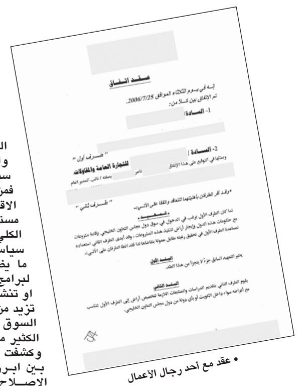
• عقد مع أحد رجال الأعمال

السياسة والاقتصاد وجهان لعملة واحدة وطالما يسعى الإخوان لدور سياسي كبير في المجتمع الكويتي فمن المؤكد أنهم سيضعون الشأن الاقتصادي في قمة اولوياتهم مستقبلا وعلى مراحل اولها الاقتصاد الكلي من خلال المساهمة في وضع سياسات اقتصادية فاشلة للدولة وهو ما يظهر بشكل واضح في اقتراحاتها لبرامج اقتصادية فشلت في دول كثيرة او تنشيط شركاتهم بضخ سيولة حكومية تزيد من فاعلية محافظتهم وصناديقهم في السوق المحلي للسيطرة والاستحواذ على الكثير من المراكز المالية المؤثرة. وكشفت المصادر عن شركات اقتصادية بين ابرز رجال اعمال الجماعة وجمعية الإصلاح والحركات الاسلامية التابعة